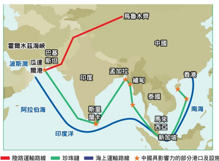
圖 4-1 中國大陸珍珠鍊戰略相關國家

現全面建成小康社會目標，進而實現中華民族的偉大復興，都具有重大而深遠的意義。」習近平又說：「21世紀，人類進入大規模開發利用海洋的時期。海洋在國家發展格局，和對外開放中的作用更加的重要。在維護國家主權、安全、發展利益中的地位更加突出。」 7 綜合以上習近平談話，中國大陸要達到實現中華民族的偉大復興，向海洋擴展是勢在必行的，相關的政策包含「珍珠鍊戰略」、「一帶一路」等，以拉攏周邊國家，爭取其海權擴大。