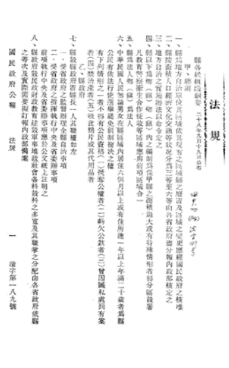
▲ 1939年公布「縣各級組織綱要」。

換言之，日治時期的州廳、街庄，可對應國民政府地方制度之縣、鄉鎮，原有的「廳」於戰後變更為「縣」後，同樣被視為法人，而日治時期地方行政區劃中的「郡」與國民政府的「區」，從體制而言，兩者皆為地方制度中的特殊存在。