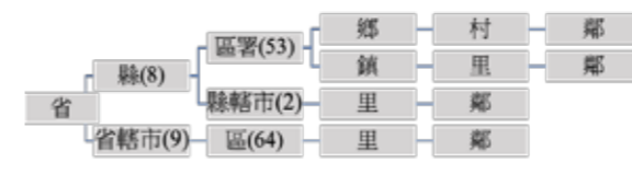
▲ 戰後初期臺灣的地方行政區劃 (1946)。 ▶ 1946年頒布「臺灣省山地鄉村組織規程」。(資料來源：《臺灣省行政長官公署公報》，1946年8月12日)

至於山地行政部分，戰後初期，公署民政處曾會同相關單位組織「高山族施政研究委員會」、「高山族施政考