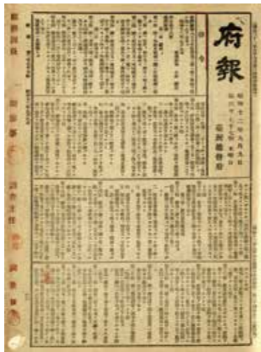
▲「臺灣廳制」公布。（資料來源：〈臺灣總督府府報第3077號〉，1937年9月9日）

1937年，中日戰爭爆發後，小林躋造總督頒布「臺灣廳制」，花蓮港廳、臺東廳亦實施郡、街庄制（藍奕青，2020）。相較於州，廳並沒有被賦予法人地位，廳協議會則為諮詢性質，