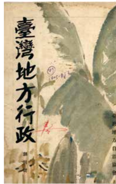
▲1935年《臺灣地方行政》創刊號。

依據1945年3月國民政府軍事委員會委員長蔣介石核定之「臺灣接管計畫綱要」，地方政制部分以臺灣為省，接管時成立省政府，下設縣（市）政府，就原有州廳、支廳、郡、市改組之，臺灣原有之三廳改稱為「縣」，不變更其區域。原有之州（市），以人口、面積、交通，及原有市、郡、支廳疆界（以合二、三郡或市或支廳，不變更原有疆界為原則）為標準，劃分為若干縣（市），縣可分為三等。街庄改組為鄉鎮，其原有區域亦暫不變更，保甲暫仍其舊。二戰未結束以前，中央設計局臺灣調查委員會（臺調會）針對接收後的臺灣行政區劃，其實有過不少討論與劃分，但從接管綱要而言，新政權對