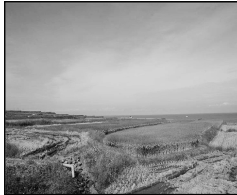
圖2 花蓮縣豐濱水梯田現況