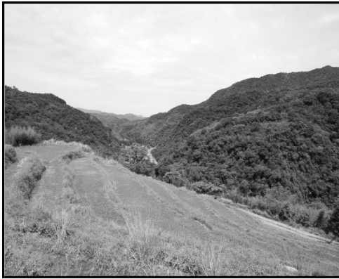
圖1 新北市貢寮水梯田現況