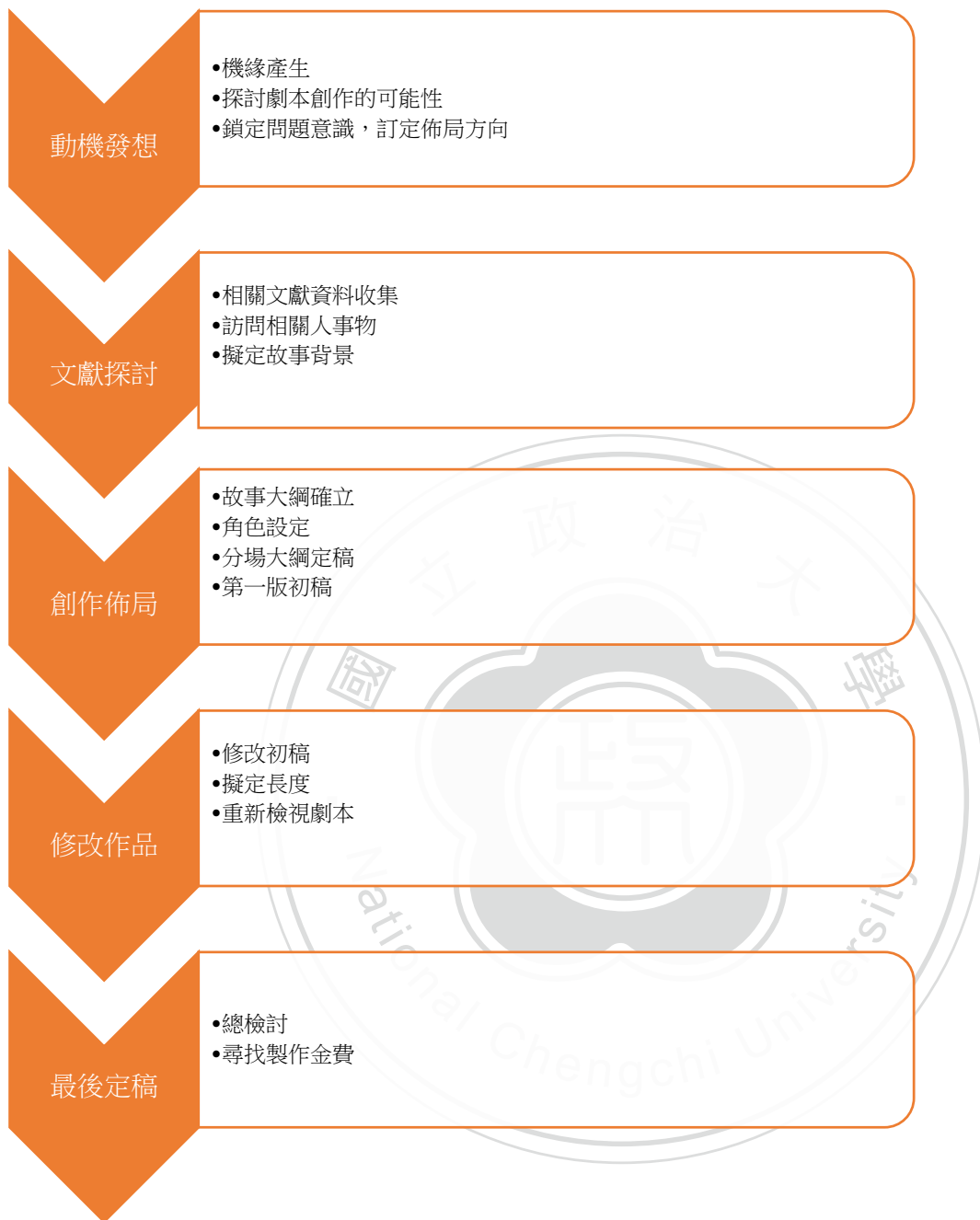
圖表1-1. 創作方法流程圖