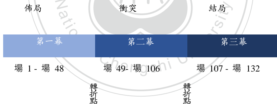
圖表3-2. 《藍色毛線衣》三幕劇架構

筆者將本劇設計成 132 場，分成三幕來呈現。第一幕佈局，設定為第 1 場至第 48 場，而第 49 場到第 106 場為中間段的第二幕衝突，而最後的結局為第 107 場至第 132 場為第三幕。另外，為了讓故事能在每一幕之間有順暢的接合，第 44 至 48 場為第一轉折點，將故事發展帶入到第二幕開頭，而第 104 至 106 場為第二轉折點，確保故事勾往結局發展。