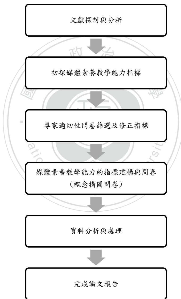
圖 1-1 研究流程圖

本研究首先蒐集整理媒體素養教學能力相關研究及文獻，分析探討其中的構面層次，接著彙整歸納出指標內容。接著，以概念構圖整合專家學者與教育現場人員對指標的分類，以建構教師媒體素養教學能力的指標構面，探究專家學者與教育現場人員對於指標重要性和應用性的評估，提出切合實際教學場域的策略指標。最後進行資料分析，完成論文報告。整理上列步驟，歸納研究流程圖，如下(圖 1-1)：