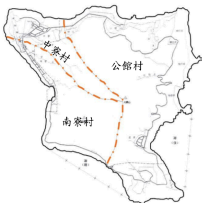
圖 1 綠島鄉行政區域分界圖

公館村的範圍包括島嶼的東半部，除了公館本村之外，還包括許多小型的聚落，其中柴口於日治時期劃屬中寮村，戰後才劃歸公館村，其他的小聚落包括流麻溝、楠仔湖、柚仔湖、海參坪及溫泉等聚落，多位於沿岸的灣澳內。這些聚落在環島公路開通後，及戰後經濟型態的改變，許多對外交通不便且位於岸下的灣澳多已廢村。