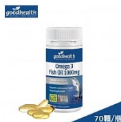
【壽滿趣】紐西蘭 goodhealth 深海純