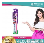
LION獅王 細潔超柔護齦牙刷 單入(顏色)