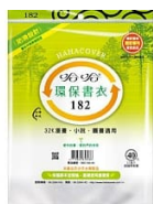
(3包1套)哈哈防滲環保書套182