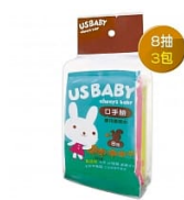
【優生】口手臉柔 潤濕巾8抽3入組 1袋