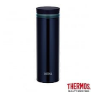
【THERMOS 膳魔 師】超輕量 旋蓋式