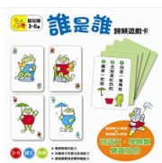
誰是誰 歸類遊戲卡 彩色