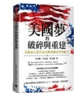
美國夢的破碎與重 建：從總統大選看