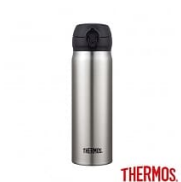
【THERMOS 膳魔 師】超輕量 不鏽鋼