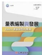
量表編製與發展： Rasch測量模型的應