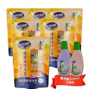
【箱購】南僑水晶 葡萄柚籽抗菌1.6kg