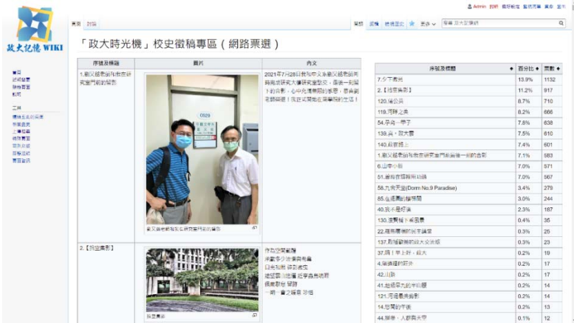
圖 2 校史徵文平臺網路票選專區