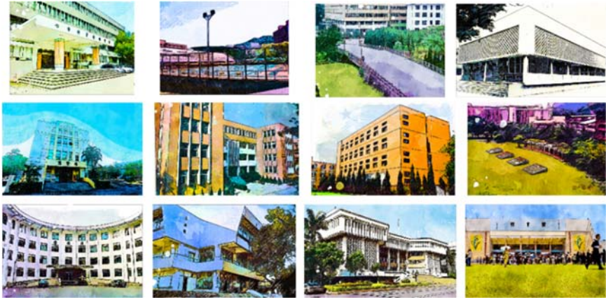
圖 7 政大校園景觀手繪風格圖