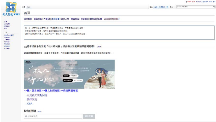
圖 1 政大記憶維基網首頁