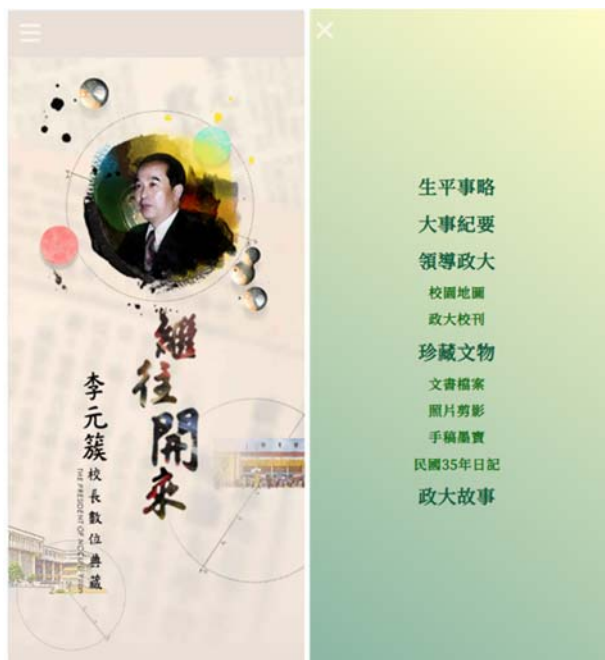
圖 6 手機版主視覺及選單