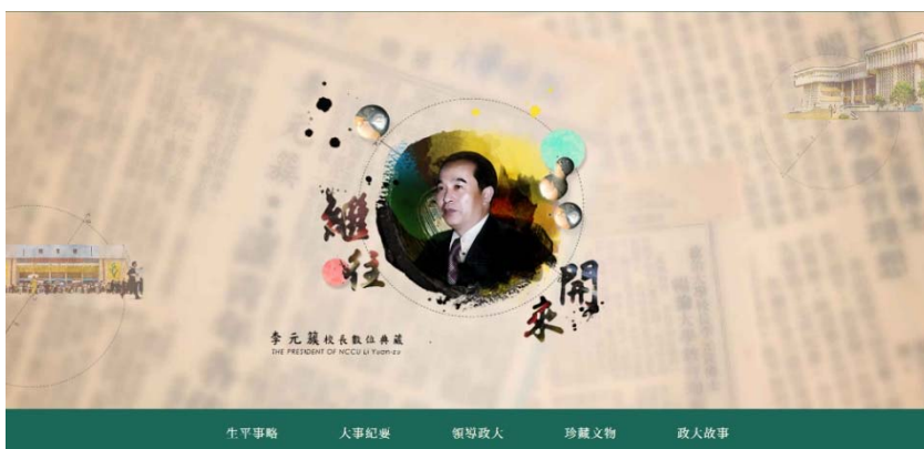
圖 5 李元簇校長數位典藏網站首頁主視覺