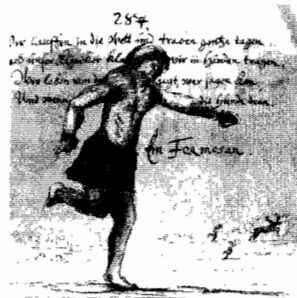
◀ 龍騰版的第一章首圖

1992年台灣教授協會曾經完成「體檢國小教科書」的工作，根據當時卑南族學者孫大川教授從族群觀體檢國小社會人文教科書的結果，指出教科書有「漢族中心主義」、「白種人中心主義」、「都會主義和泛政治化」的矛盾與不健康現象(吳密察、江文瑜1994：179-186。)，多年後教科書中這些刻板印象是否已經消失？