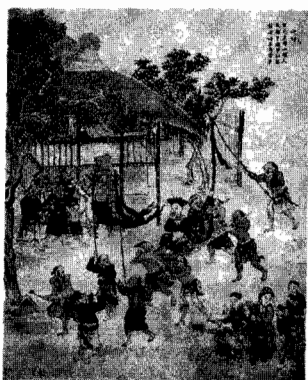
◀ 引自龍騰版 《高中歷史》第一冊， 頁16，《蕭壠城記》 課文配圖是18世紀彰化 的平埔族，時空不符合。

識台灣早期原住民，但是筆者覺得一直強調說就是對原住民主體的嚴重藐視，例如頁11-12「沒有歷史」的民族，在與外來者遭遇後，「開始有機會被外來者留下來文字記錄，可知的歷史內容才日漸豐富，因為原住民的移動及片斷而不完整的歷史」。真正被觀察到的其實以台灣南部平地的原住民為主，特別是台南一帶的西拉雅族。這反映的仍是狹隘的、過時的「有文字才有歷史」的史觀。與其教導大家去從外來者陳第《東番記》和荷蘭人的《蕭壠城記》的資料認識原住民，為何不教導去認識原住民族口傳的起源神話與傳說呢？為什麼不承認原住民主體的口傳敘事的歷史言說呢？而且課文中只摘要中國官員陳第的紀錄來呈現17世紀剛開始的原住民的社會與文化（頁13-16），沒有任何評論與民族別說明，會造成干擾，讓學生用泛原住民的觀點來模糊看待現在認定的原住民13族，無助於台灣多民族的相互理解與族群和諧。