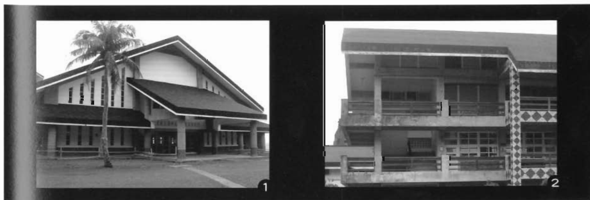
圖1：綜合活動中心 圖2：幾何圖形為原住民特有圖騰文化，本校教室大樓樑柱以砌卵石建構成具蘭嶼圖騰文化特色

雅美族傳統地下屋斜屋頂及卵石砌牆，斜面式建築能防風防雨，景觀設備同時具有民族風格和現代化水準。主要建築有教學大樓、實習工廠、行政大樓、多功能活動中心（含室內球場、美術教室、音樂教室、原住民教育中心、圖書館）、教職員宿舍，以及學生宿舍（每間4人套房）。其中，教學大樓為雙走廊設計，備有座椅，便於賞山看海。未來將以渾然天成的自然景觀，結合島上特有植栽，營造更為理想的學習環境。