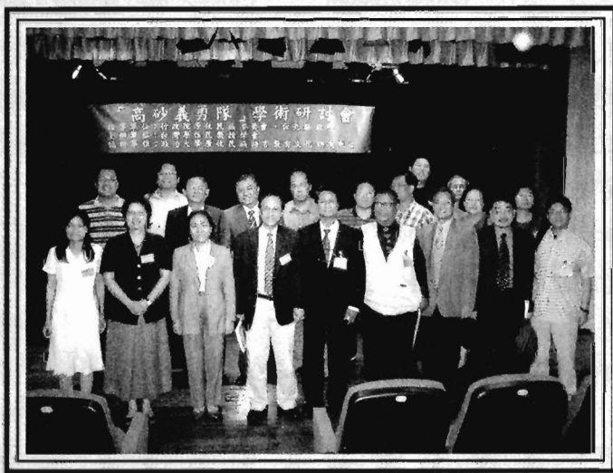
▲ 高砂義勇隊紀念學術研討會與會人員合影。

2006年5月26日（五）上午九時至下午五時，台灣原住民教授學會在文化大學推廣部建國本部B1表演廳舉行「高砂義勇隊」紀念學術研討會。