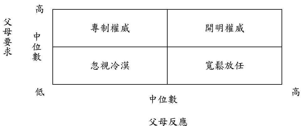
圖3-3-1 父母管教方式類型 資料來源：王鍾和（1993：13）

量表的向度分為二，一為「反應」（1到15題）；另一為「要求」（16到30題），共計三十題，並分為父親版本和母親版本。兩個向度同時考量，且以全部受試在「要求」或「反應」上所得分數的中位數為分界點，將兩層度分為高低兩層面，再組合成「專制權威」、「寬鬆放任」、「開明權威」、「忽視冷漠」四種不同管教類型（如圖3-3-1）。類型說明如下：