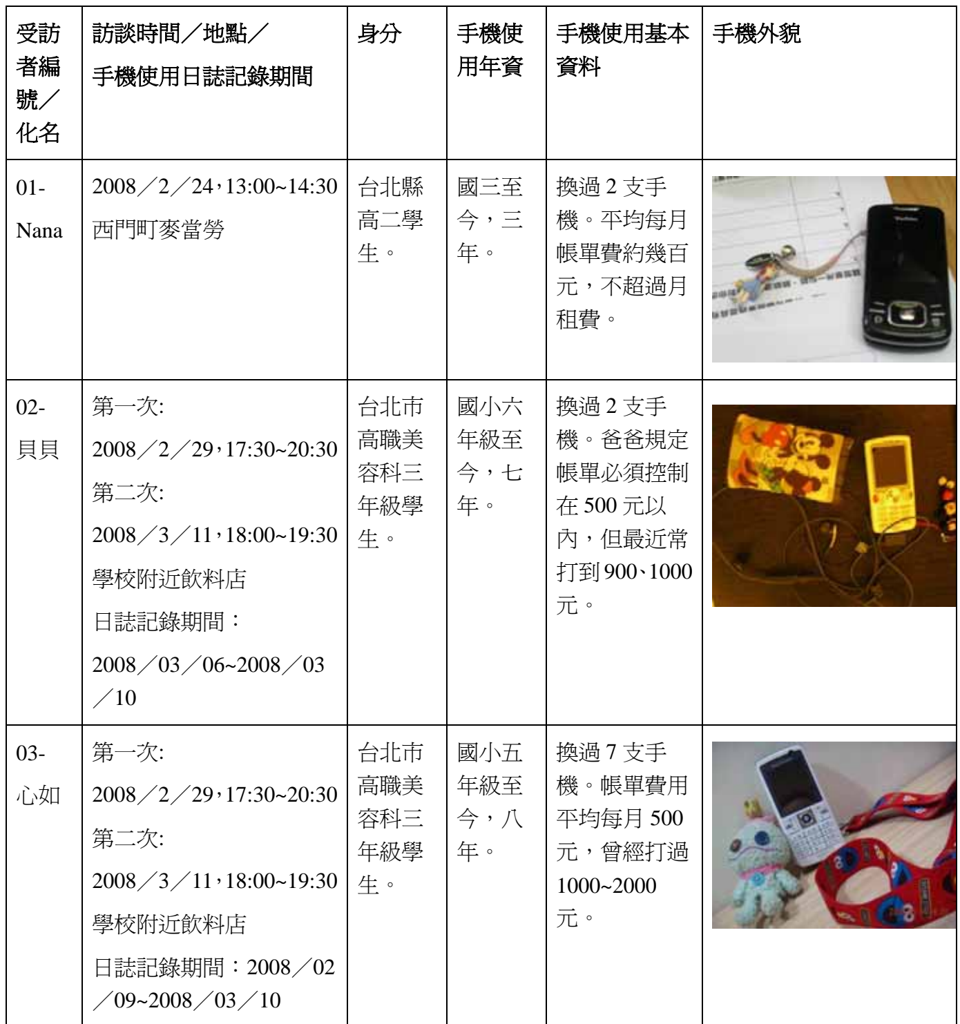
表 3-1 受訪者基本資料與研究資料收集期間