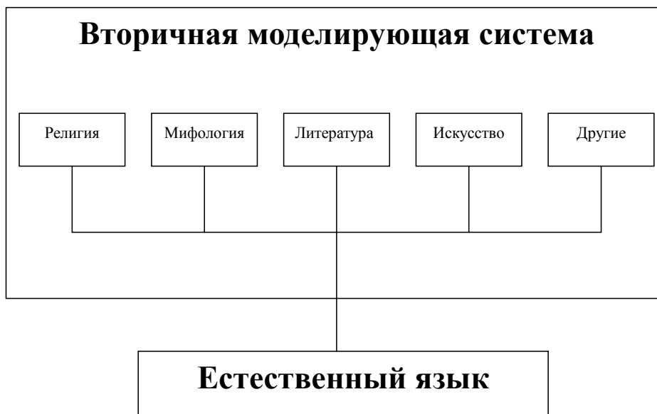
Рис. 1. Вторичная моделирующая система

обнаружить влияние мифа на культуры человека. Как полагает русский литературовед Лотман, мифология есть вторичная моделирующая система,строенная на естественном языке, как один из текстов в культуре. Ее место в культуре видно на Рис. 1: