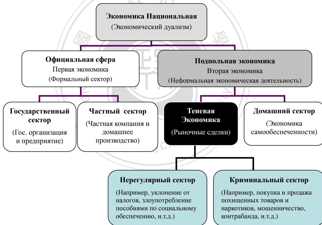
Рис.1.1. Экономический дуализм

Составлено по: Schneider, Friedrich and Enste, Dominik H. The Shadow Economy. Cambridge: Cambridge University Press, 2002. P.8, 11.