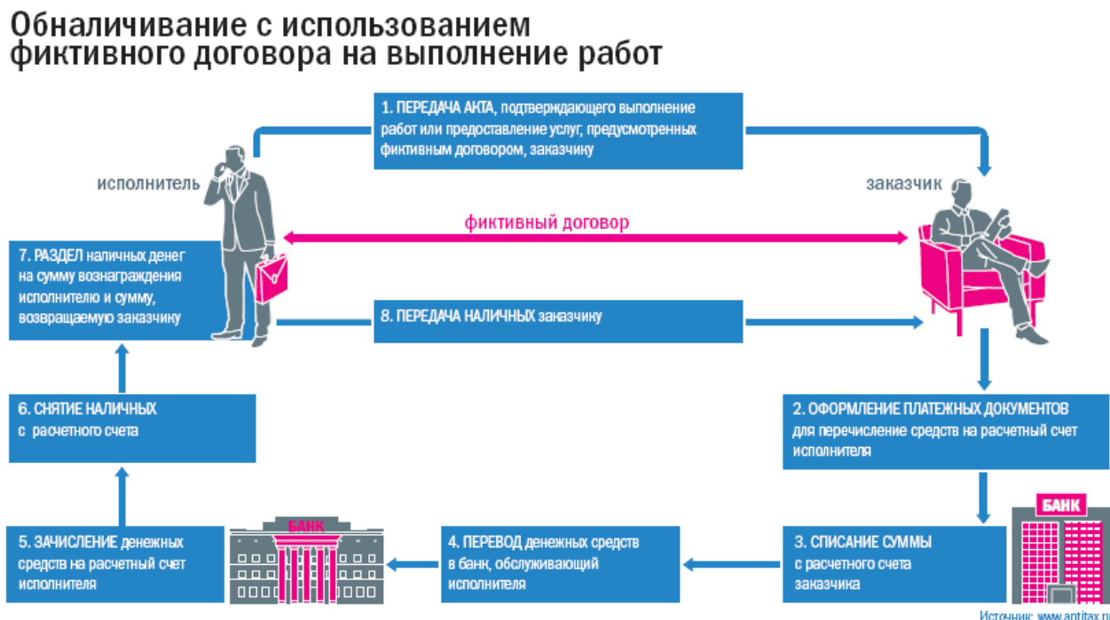
Рис. 2.2. Схема обналичивания с применением фиктивного договора на выполнение работ

Цит. по: Петрова Ю. Операции с душком // Секрет фирмы. 22 октября 2007. №.41(224). ( http://www.kommersant.ru/doc.aspx?fromsearch=66c58b6c-3c0c-4506-9ce3-e8874093b9a7&docsid=858890 , доступ получен 9 марта 2008).