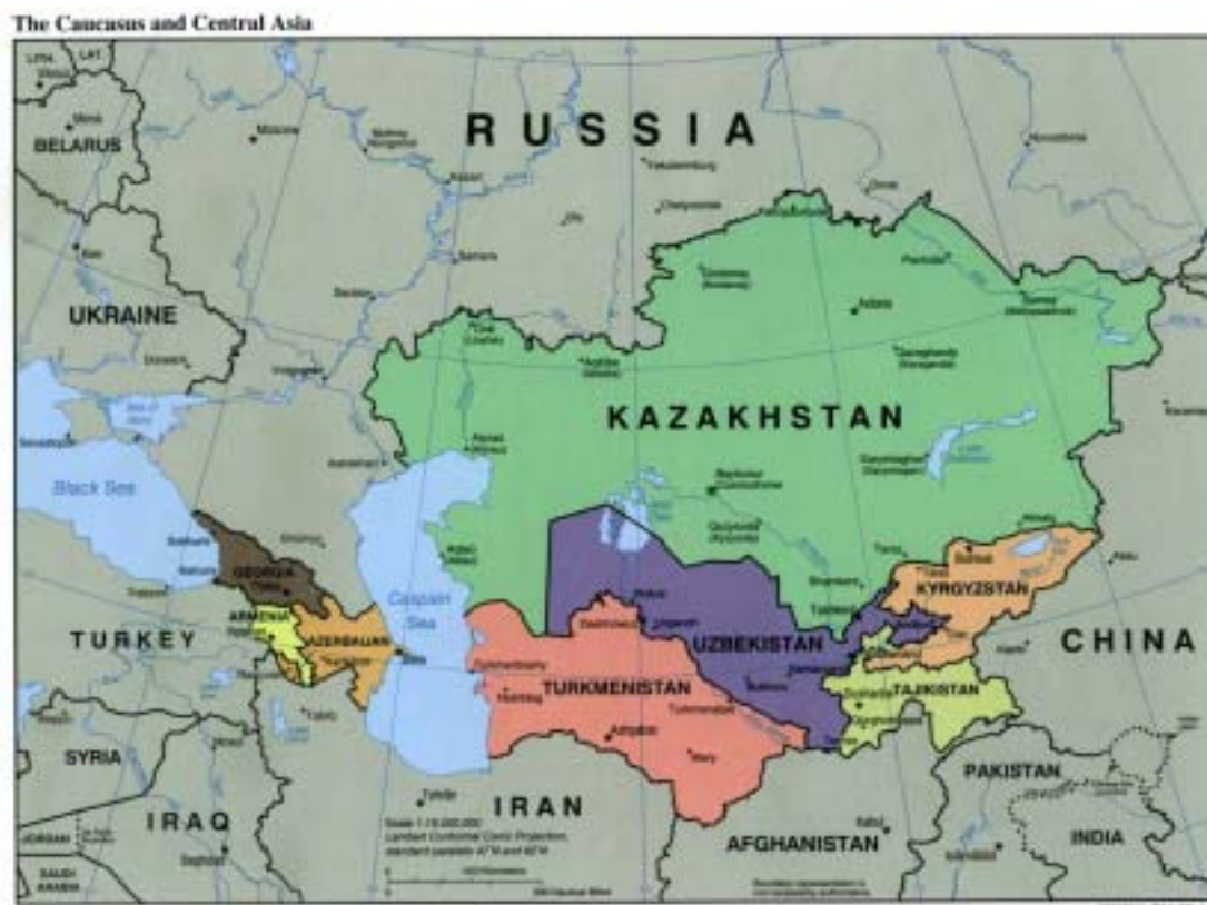
(圖 5-1) 裏海地區周邊國地圖