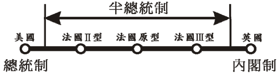
圖 二十四「類」與「非」總統制光譜圖

依據 Duverger 對半總統制的定義：(1) 總統由普選產生；(2) 依憲法規定總統有一定的權力；(3) 總理與內閣成員需要國會支持才能任職並擁有行政與政府的權力。就筆者的分析，第一與第二個定義與總統制並無二異，重點在於第三個定義上。若以憲法規定來看，國會的確有追究政府責任的權力（憲法 117 條），但是以俄羅斯的憲政發展來看，俄羅斯政府總理並未出現需要國會信任才得以獲得政府行政的權力，在憲法 111 條的規定下，反倒是政府總理行政權力需受到總統的支持。總結就俄羅斯政府體制實際運作模式並未出現半總統制的因素在於：