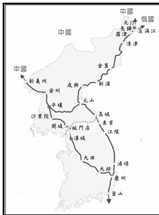
【圖2-2】朝鮮半島南北公路連結圖