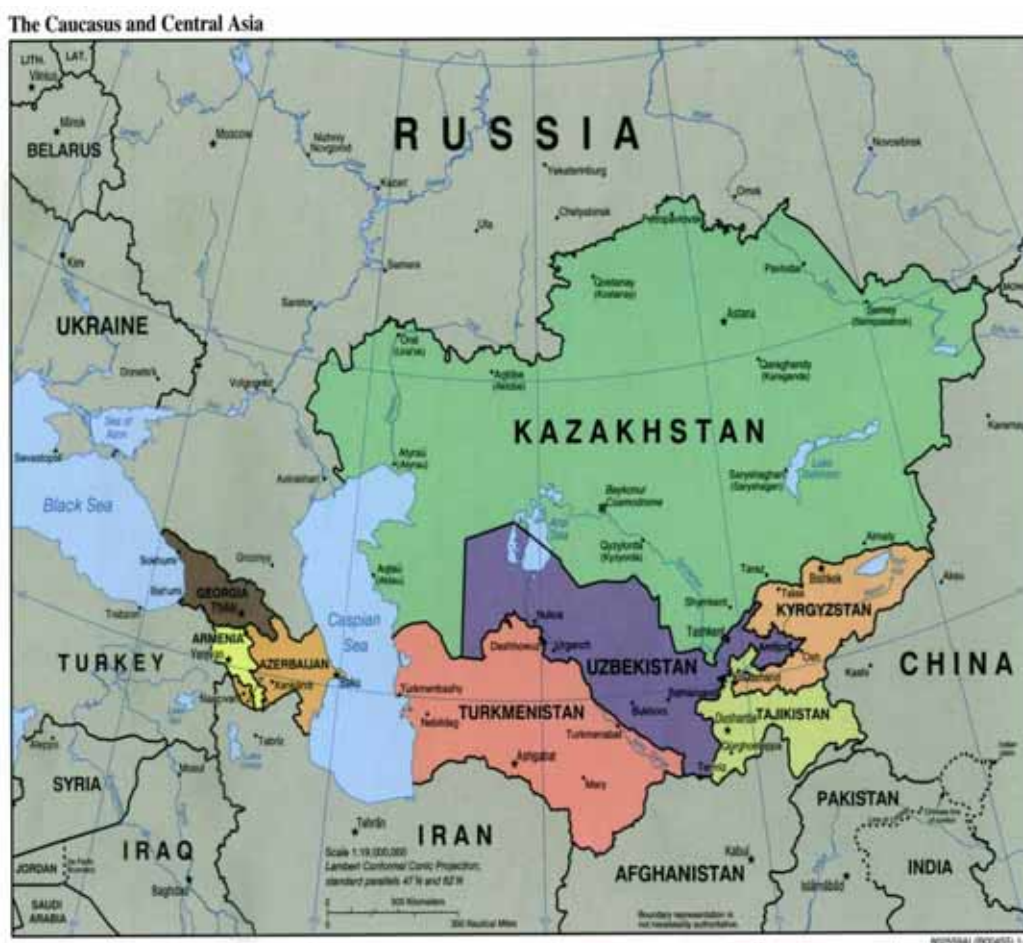
圖 1-1-1 中亞五國及其週邊國家形勢圖