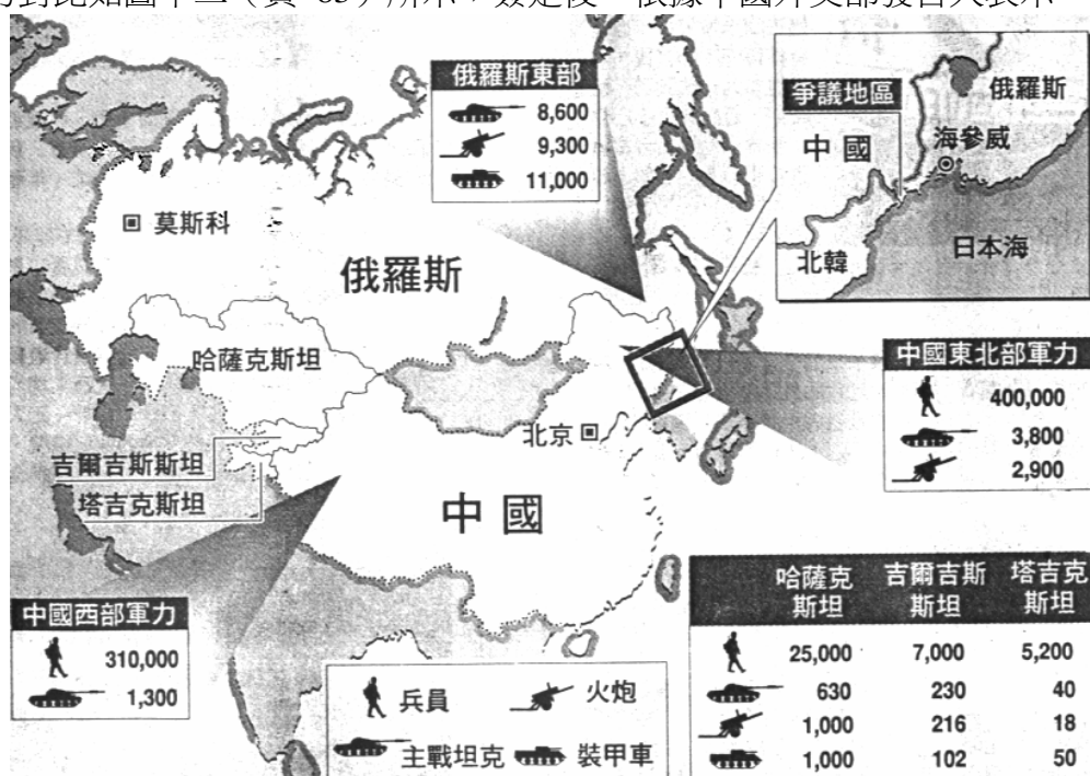
圖十二、中國與俄羅斯、哈薩克斯坦、吉爾吉斯共和國、塔吉克斯坦共和國四國邊境軍力對比

裁軍議題的實踐，於1989年即開始進行，至1997年時五國簽定裁軍協定，簽署之五國將循協定內容裁減、保留邊境一定範圍內之軍備數量，且定期交換簽署國彼此情報資料，而此軍情資料將對第三國保密。在簽定裁軍協定前，簽署國軍力對比如圖十二（頁83）所示；簽定後，根據中國外交部發言人表示，雙方