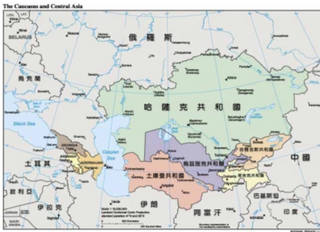
圖 1-1-1：中亞五國地圖位置示意圖