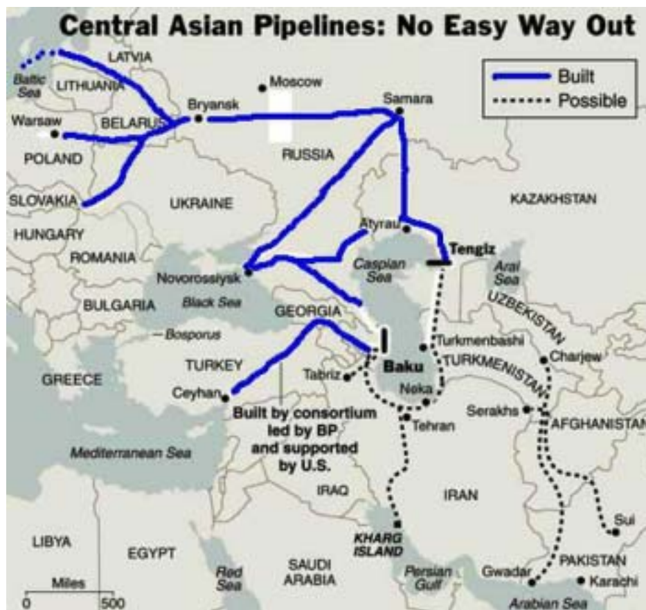
圖 1-1-4：裡海地區石油管線圖