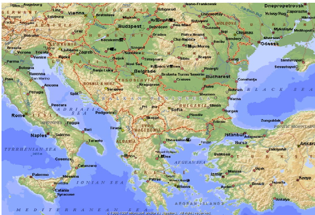
附圖一：波士尼亞地形圖