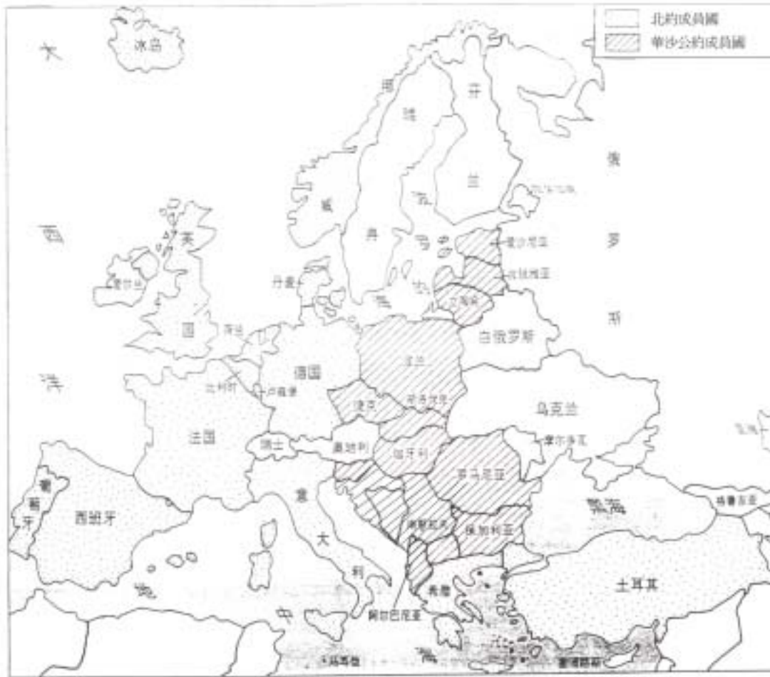
圖 2-3 蘇聯第二次世界大戰後建立戰略緩衝區示意圖