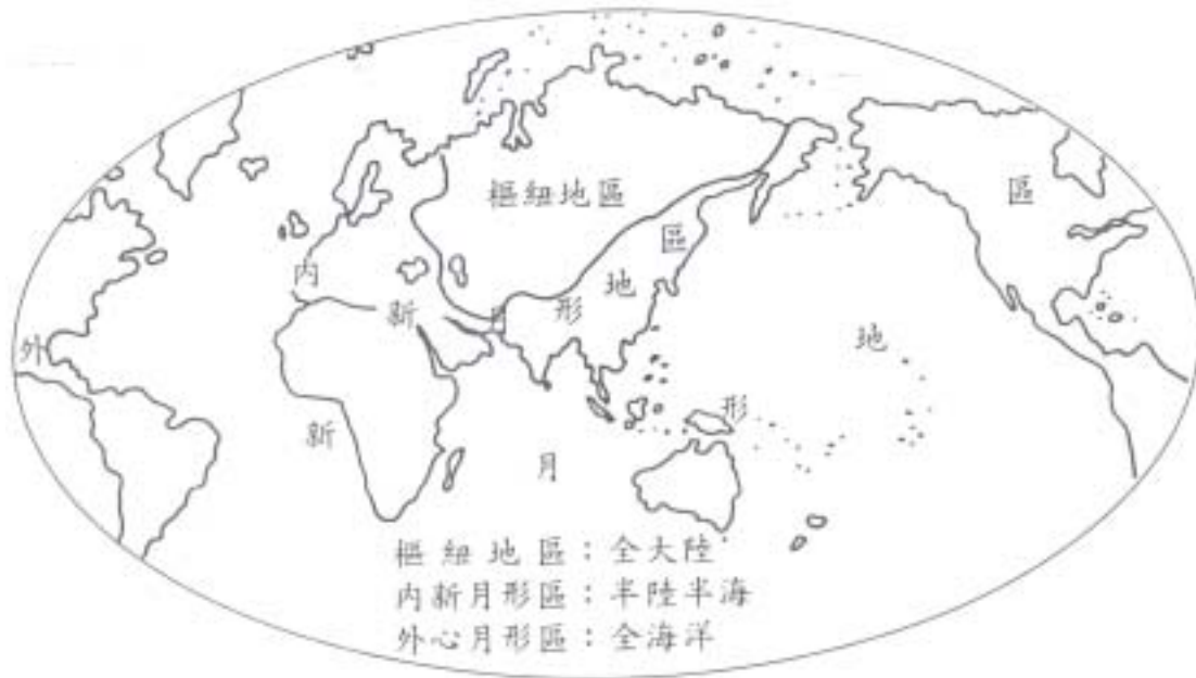
圖 2-4 麥金德的世界觀