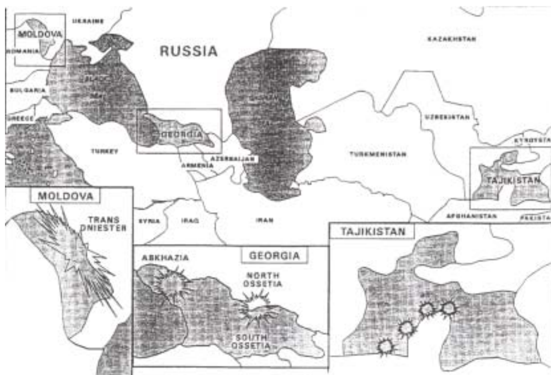
圖 4-1 俄羅斯在摩爾多瓦、喬治亞與塔吉克之維和行動區域