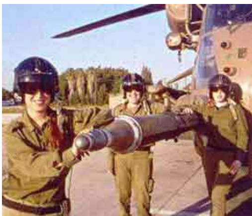
圖 3-1 669 部隊首次有三位女性空中醫務員

2001 年 6 月 29 日首位女性戰鬥飛行員羅妮.查克門（Roni Zuckerman）畢業，她是以色列空軍 53 年來的第一個戰鬥機飛行員。 14 在 669 部隊首次有三位女性空中醫務員（如圖 3-1），在戰鬥直昇機方面，目前有三位女性以色列空軍機械員，其中一位指派至 CH53（如圖 3-2）二位被指派至 UH60 黑鷹戰鬥直昇機（如圖 3-3）。 15