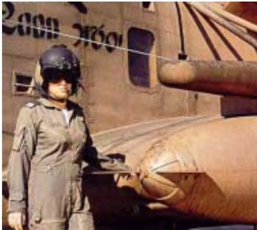
圖 3-2 第一位 CH53 女性空軍機械員