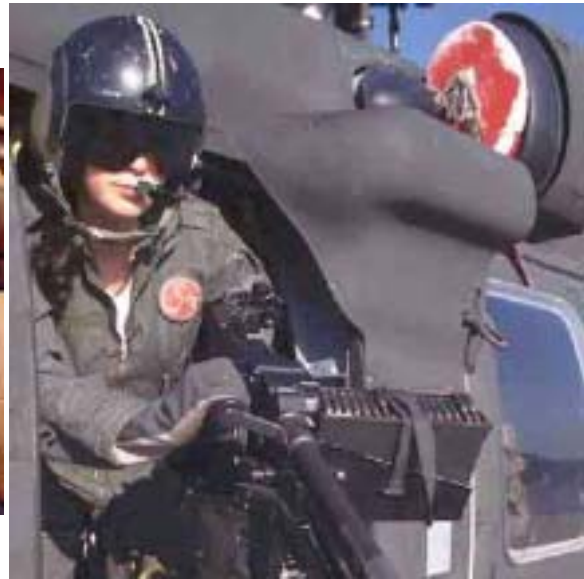
圖 3-3 第一位 UH60 黑鷹戰鬥直昇機女性空軍機械員