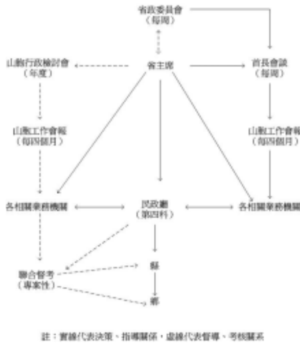
圖 3-1：省主席時山胞(原住民)行政決策與督導系統圖