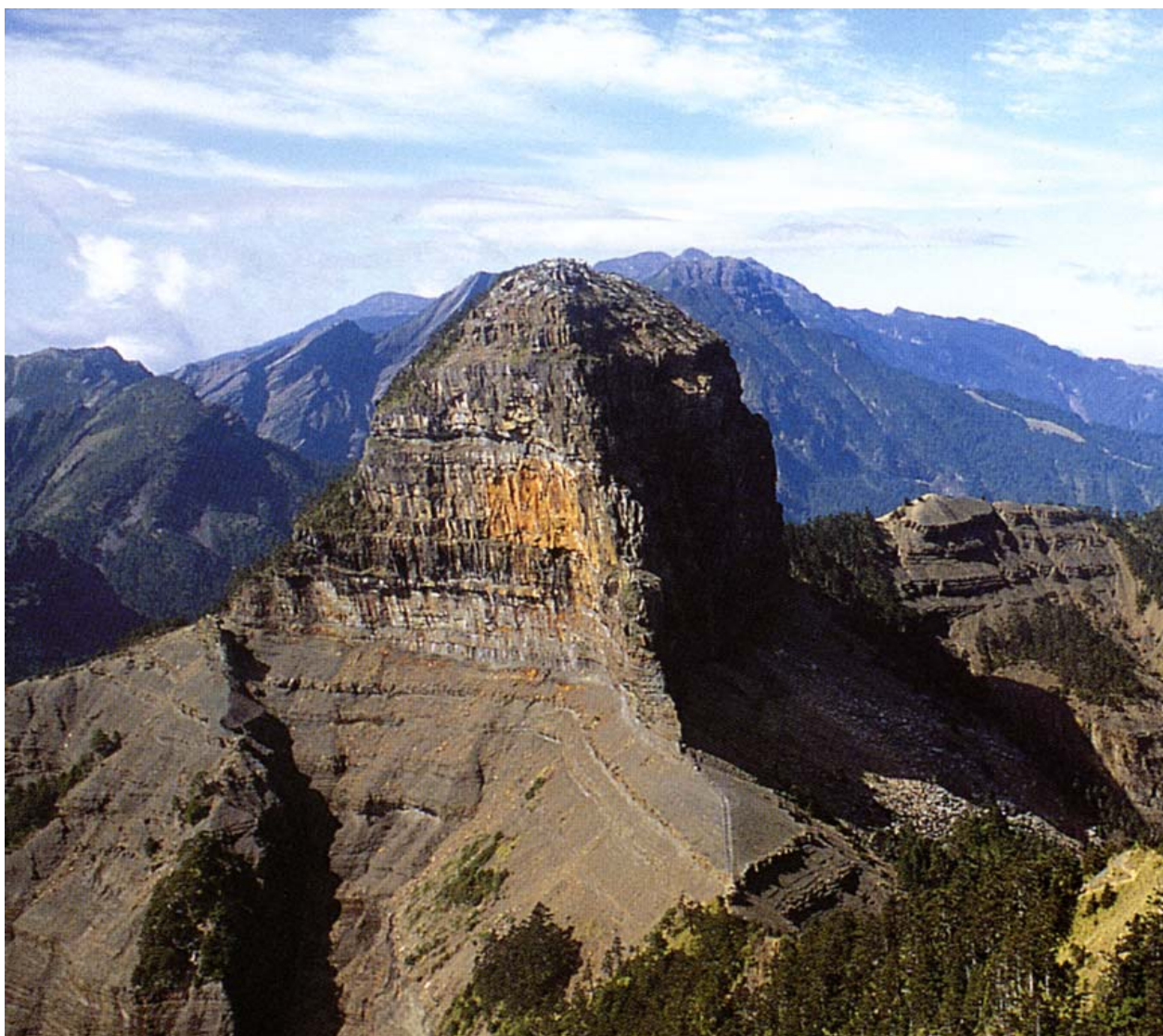
圖 2-2-1 Papak wa(q)a 大霸尖山