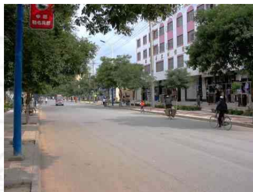
圖四：循化縣積石鎮街景 資料來源：王懷璟 2003/7/26