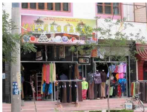
圖十四：循化縣上的伊佳民族用品專 賣店