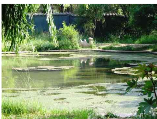
圖五：駱駝泉 資料來源：王懷璟 2003/7/25