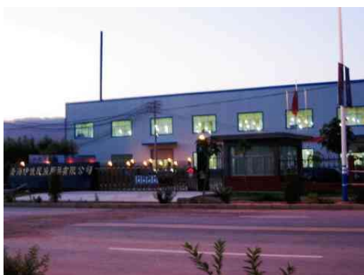
圖十五：伊佳民族用品有限公司新廠房 2005/7/11