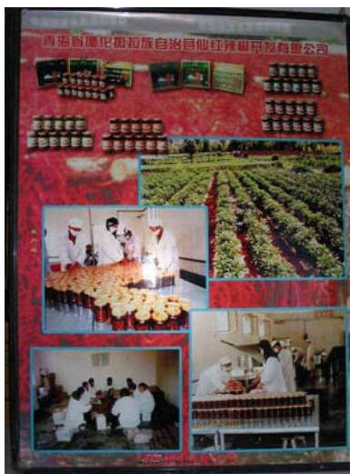
圖十一：仙紅辣椒廠生產過程廣告看板