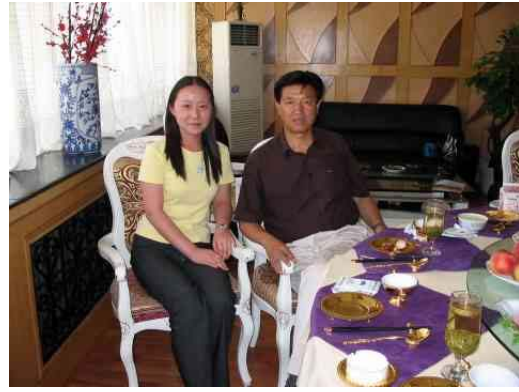
圖八：與興旺集團韓興旺總經理合照