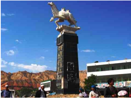
圖七：興旺集團出資建立的循化駱駝 雕像