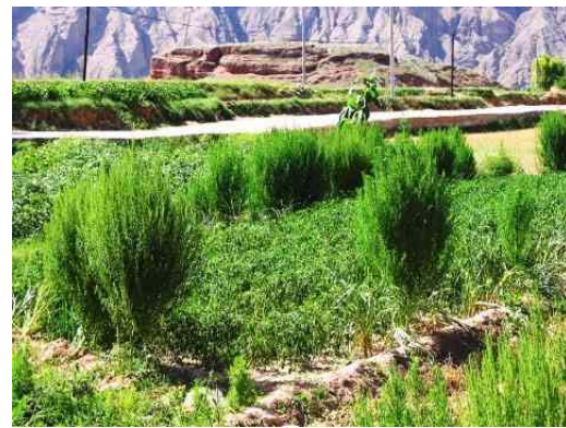
圖十：尚未成熟的線辣椒