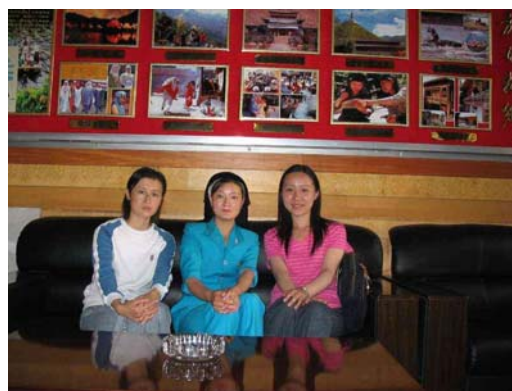
圖十六：與撒拉族職業婦女合照（中） 資料來源：王懷璟 2004/8/5