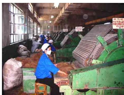
圖十八：雪舟三絨廠內理絨工作情況 資料來源：王懷璟 2003/7/25