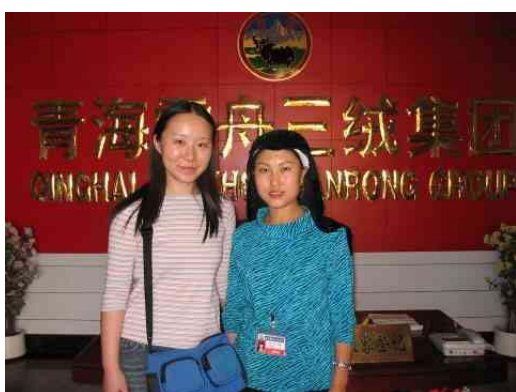
圖十七：與雪舟三絨集團管理階層女 職工合照