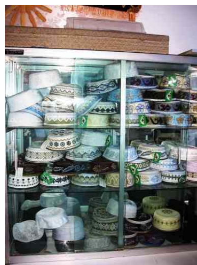
圖十二：伊佳民族用品有限公司產品