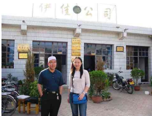
圖十三：筆者與伊佳民族用品有限公司 老闆合照