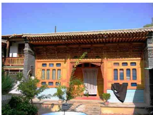
圖一：傳統的撒拉族民居建築 資料來源：王懷璟 2003/7/25