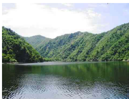
圖六：美麗的孟達天池 資料來源：王懷璟 2005/7/11