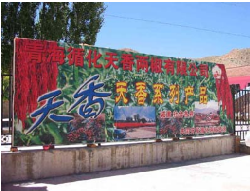
圖九：天香兩椒有限公司