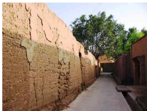
圖二：撒拉族傳統建築外的高大土牆