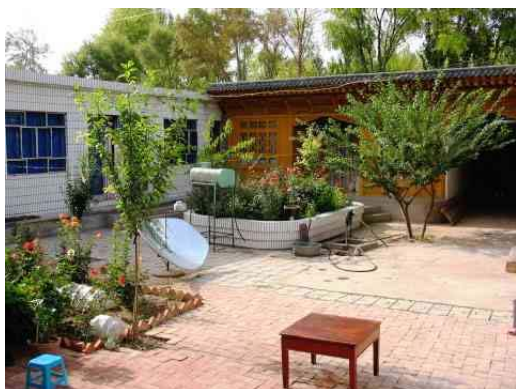
圖三：傳統與現代並存的撒拉族民居 建築