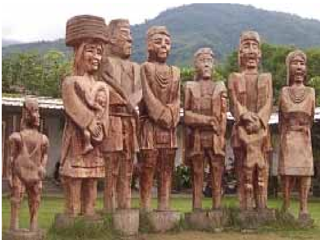
圖 3-2-3：「布農部落」大型藝術作品《中央山脈的守護者》

由於不設限創作材質，藝術家可以選取適切的材質突顯欲表達的想法。園區的創作以多元繽紛的材質展現，甚或出現混合媒材的呈現方式。然仍多以木、石、陶等天然材質做為媒材基調，呈現出原住民質樸自然的風格（圖 3-2-3）。