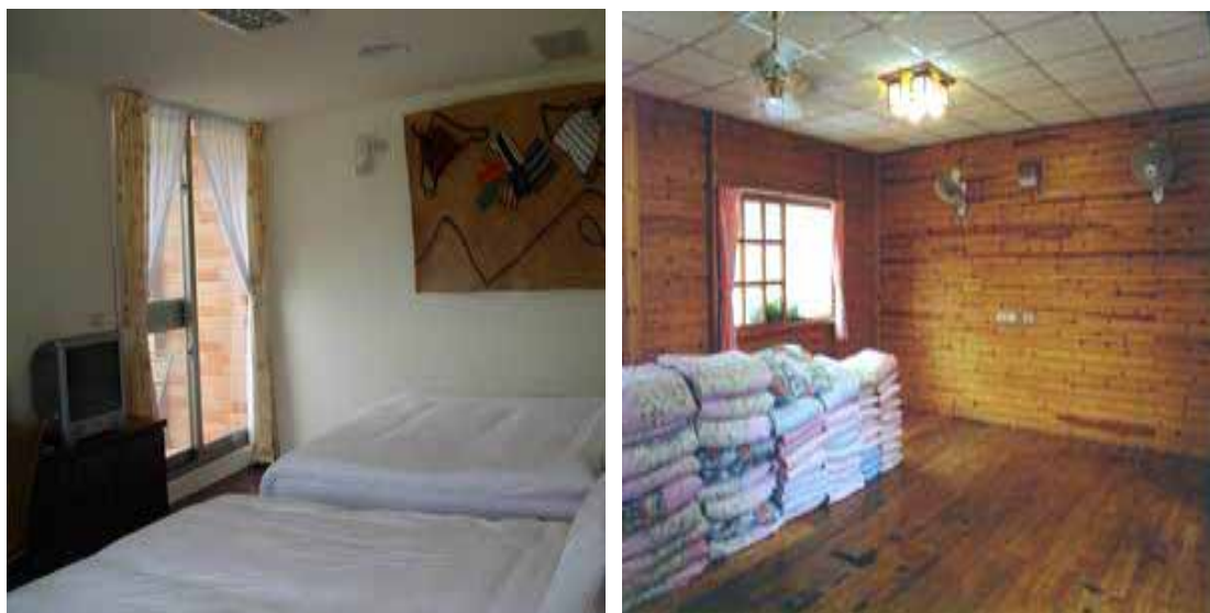
圖 3-2-8：彰基大樓雙人套房與書念住宿區之 12 人次團體房

如果到訪遊客有住宿的需求，目前「布農部落」亦提供套房與團體房兩種選擇（圖 3-2-8）。套房內備有衛浴、電視、冰箱、冷氣，設備簡單，房內也以「編織工作坊」製作的編織品做為擺飾。套房有 2 人至 7 人不等的類型選擇，共計 50 間。團體房有 3 間，每間可容納 12 人左右，屬於木板式的大通舖，主打學生群體。