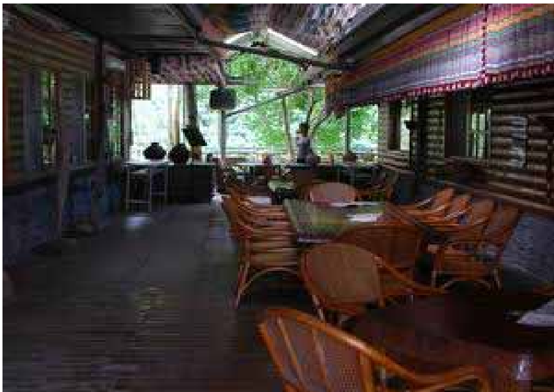
圖 3-2-6：「布農咖啡屋」右方的長廊咖啡區 說明：此處座位以木桌搭配原木色澤的藤椅，上方的屋頂與屋簷用「編織工作坊」自製色彩相間的麻質布料裝飾，呈現園區以原住民風格為基調的一體感。