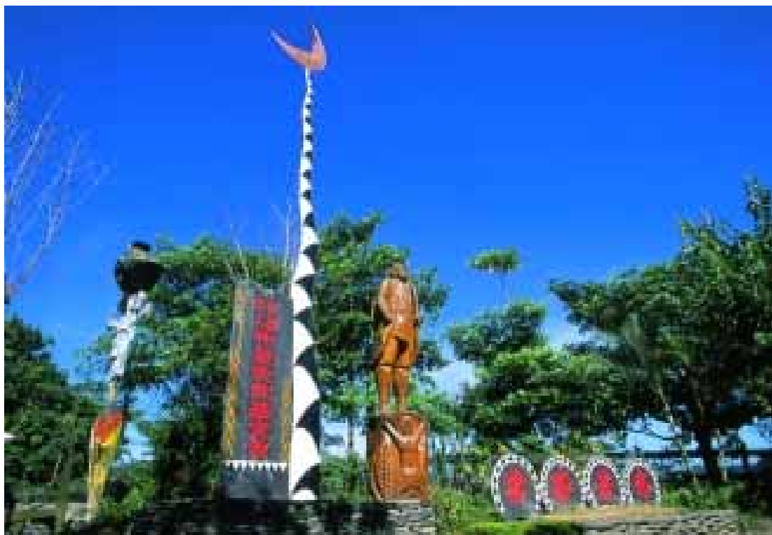
圖 3-2-1：「布農部落」園區入口處擺設之戶外藝術作品

初來乍到「布農部落」，除了原住民音樂在園區不絕於耳外，園區內常設展示的藝術作品，著實會令人印象深刻。走進園區大門開始（圖 3-2-1），許多戶外大型藝術作品，別具深意的佇立園中，不斷的激盪著遊客的視覺觀感與思考想像。