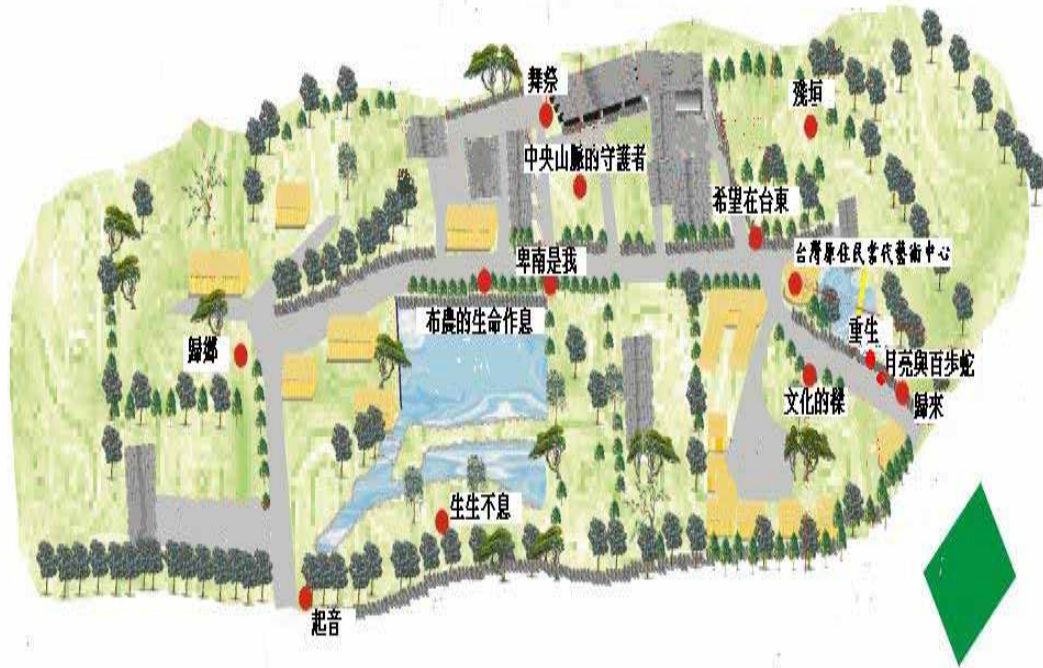
圖 3-2-2：「布農部落」戶外大型藝術品位置圖

這些深具特色的藝術作品多來自當代原住民藝術家之手，主要是民國 87 到 90 年，由布農文教基金會主辦（圖 3-2-2）「山與海的呼喚—布農文教基金會年度成果展」、「山·海·太陽光—布農部落原住民環境裝置藝術聯展」、「長虹的跨越—原住民藝術創作聯展」，以及「日昇之屋--布農部落 2001 年度大展」等幾次的原住民藝術展示策劃所創作，爾後留下的。