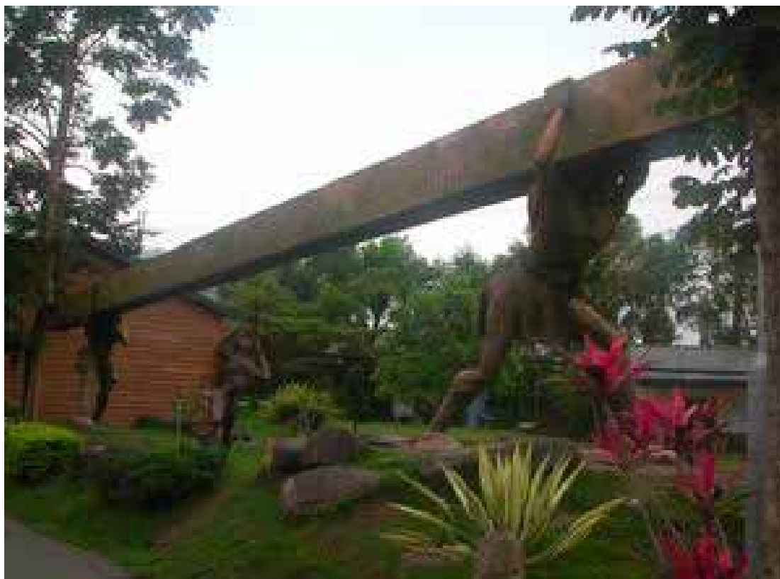
圖 3-2-4：「布農部落」大型藝術作品《文化的樑》

說明：置於園區「布農便利商店」旁，住宿 A 區前廣場。以鋼的材質加漆料做為呈現。原住民耆老與部落孩子共同背負這文化的樑，樑上以浮雕陽刻的雕刻工法，雕出布農年曆符號的傳統象徵，以及英文字母、數字象徵部落孩子必須學習的現代邏輯，隱喻部落文化傳承上的困境。亦是園區解說與遊客駐足的焦點作品之一。