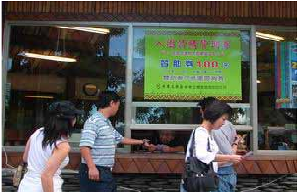
圖 3-1-3：「布農部落」大門售票口。

進入園區後，遊客可以先到「旅遊中心」稍事休息，或上個洗手間。「旅遊中心」主要提供遊客訂房、定餐、諮詢、廣播服務，以及負責接駁專車的調度。遊客在園區內，如有任何疑問，也可以透過穿著黑底菱形花邊背心制服的園區員工，協助解答。