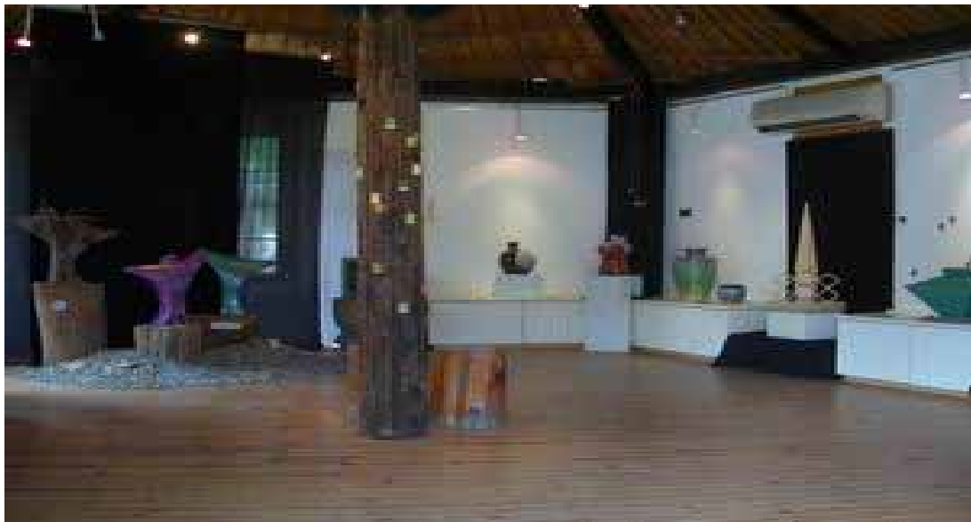
圖 3-2-7：「台灣原住民當代藝術中心」室內展示空間

……早期的藝術中心，定位會比較高一點，就是不會定位跟社區有關 現在因為我也做不來，加上專業不夠，認識的原住民藝術家也不多，我 也不想那樣做 或許做出來對學術很有貢獻，但是看的人會有什麼感 覺 我會依我的能力來看做些什麼，我會希望跟社區有互動，至少『布 農部落』的人會想進去看。 我剛來的時候，會聊天問說『你有沒有看 過』 不要講到村民，連基金會的人也不會想去看，就像連你也不知道 藝術中心在哪裡 7