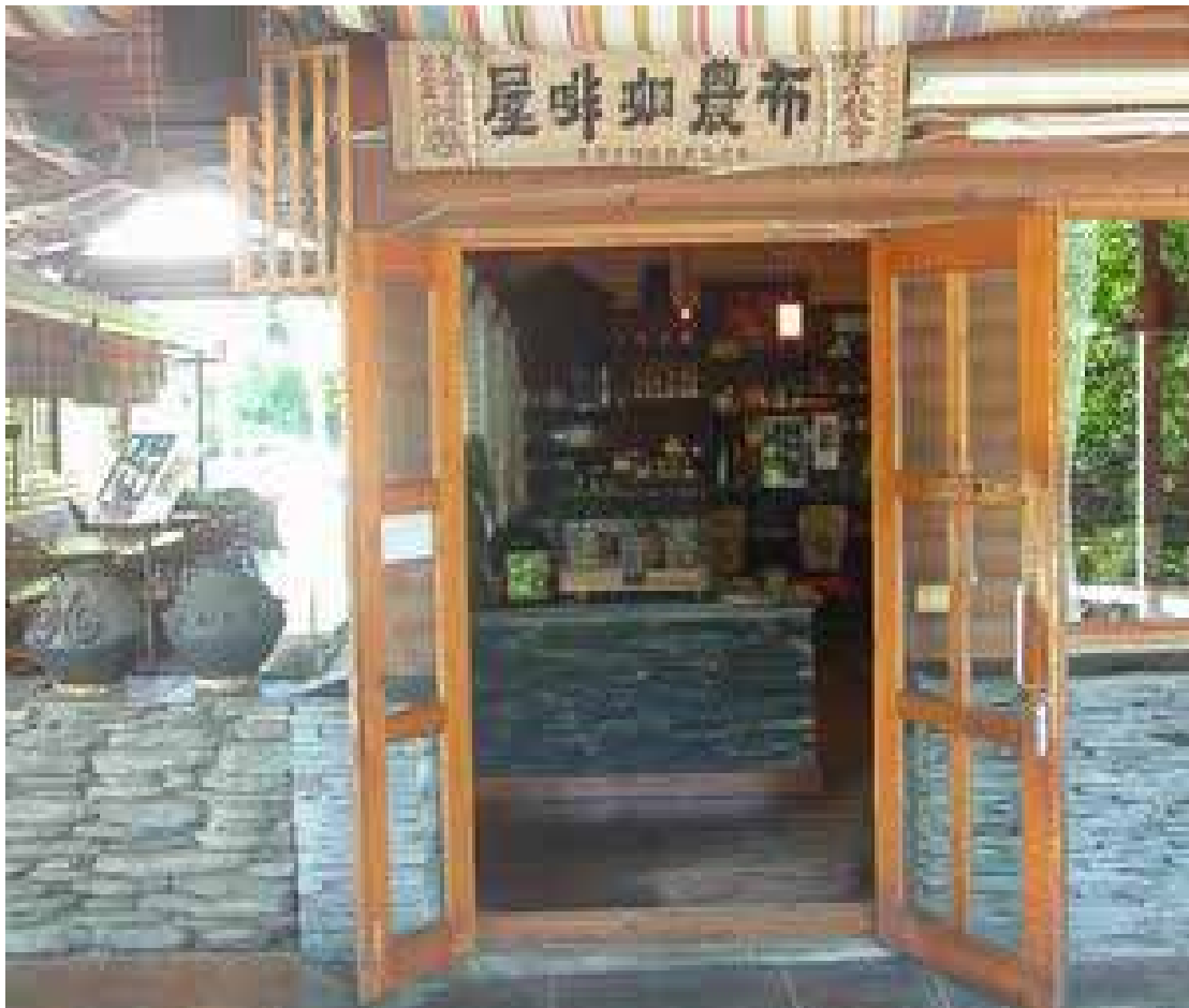
圖 3-1-5：布農咖啡屋門口

心痛，他認為我們其實可以改變生活，因此咖啡屋這樣出現了。他的目的是希望試試讓原住民接觸非酒類的飲料，期盼布農朋友能夠多接觸咖啡果汁 4