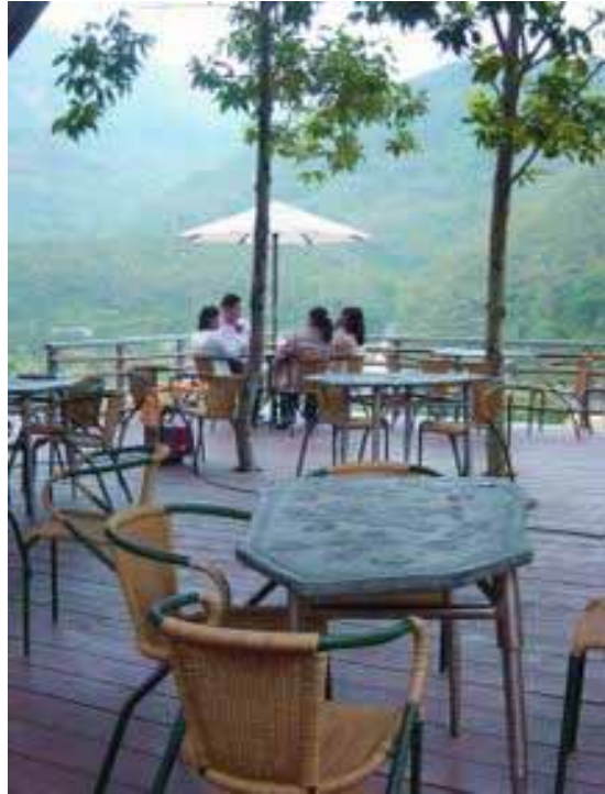
圖 3-2-5：「布農咖啡屋」前方的咖啡雅座區與右前方的露天咖啡區 說明：座位分別以石版桌面配上原木底座支撐搭配木刻座椅，以及石板桌面結合鋼骨底座支架搭配藤椅，其中石質桌面與木刻座椅皆呈現原住民風格紋飾。