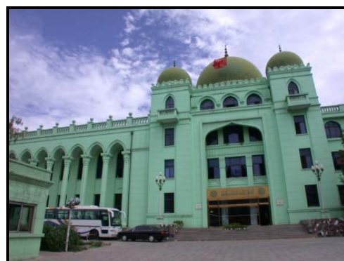
圖十三：中國伊斯蘭教經學院，亦 為中國伊斯蘭教協會所在 2005/7/12