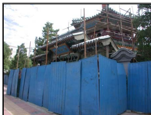
圖五：整修中的牛街清真寺外觀