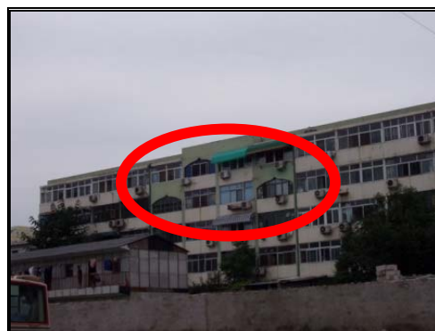
圖七：具有伊斯蘭風味的窗戶