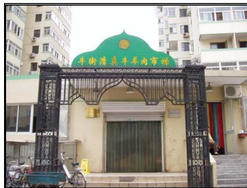
圖十一：牛街清真牛羊肉市場 2004/7/26