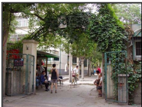
圖十六：牛街春風小區