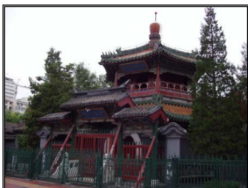
圖四：牛街清真寺外觀