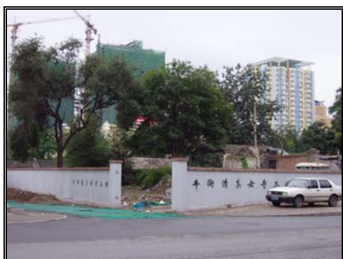
圖十八：牛街清真女寺預定地