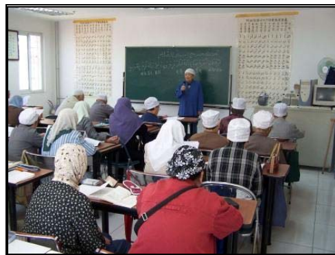
圖十五：牛街社區民間自辦學習班 的上課情況