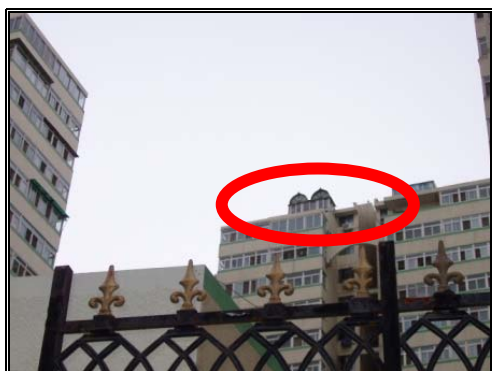
圖六：具有伊斯蘭風味的穹頂