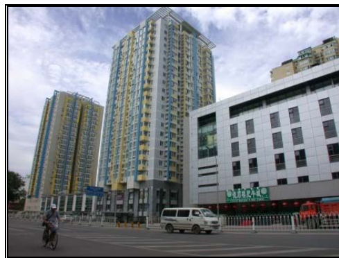
圖九：牛街街景與新建的回民住宅 2005/7/3