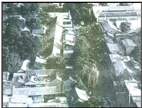
圖八：牛街拆遷前的照片 2005/10/3