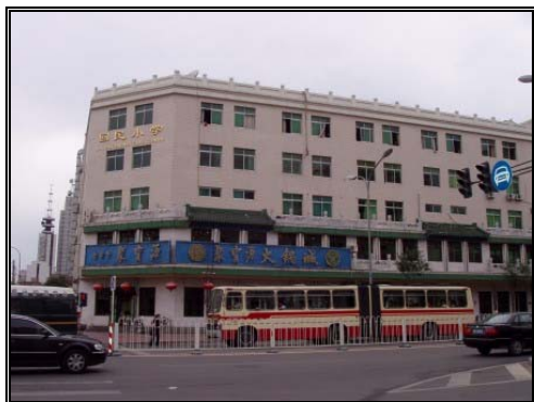
圖十：回民小學與牛街清真超市 2005/7/6