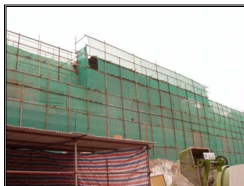
圖十九：興建中的牛街民族敬老院