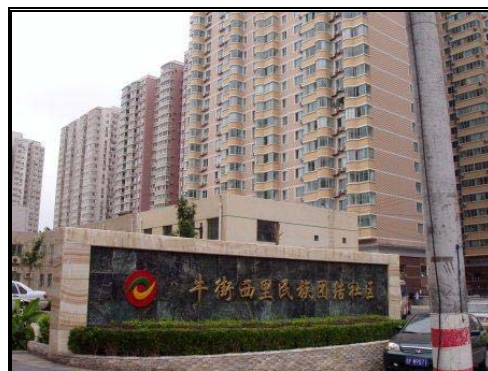
圖十七：牛街西里民族團結社區