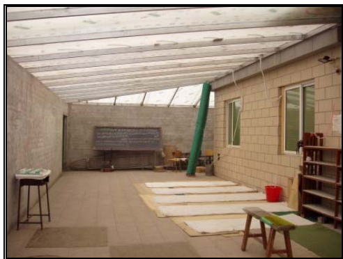
圖十四：北京牛街清真寺暫時禮拜處 資料來源：筆者攝影。