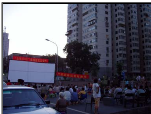
圖十二：牛街居民不分老小與民族 皆來欣賞電影 2005/7/1