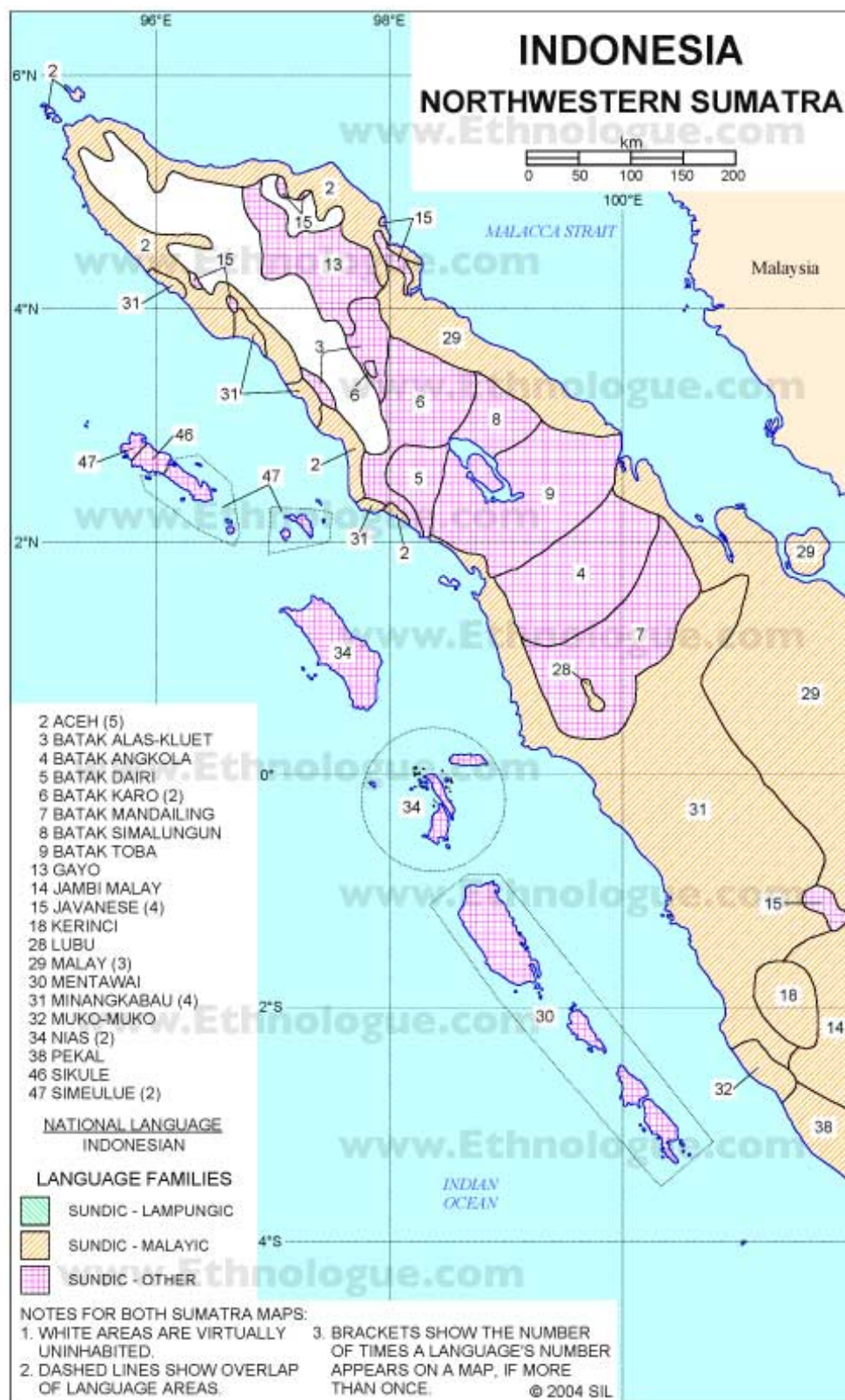
圖 1—III：亞齊地區語言分佈圖 35