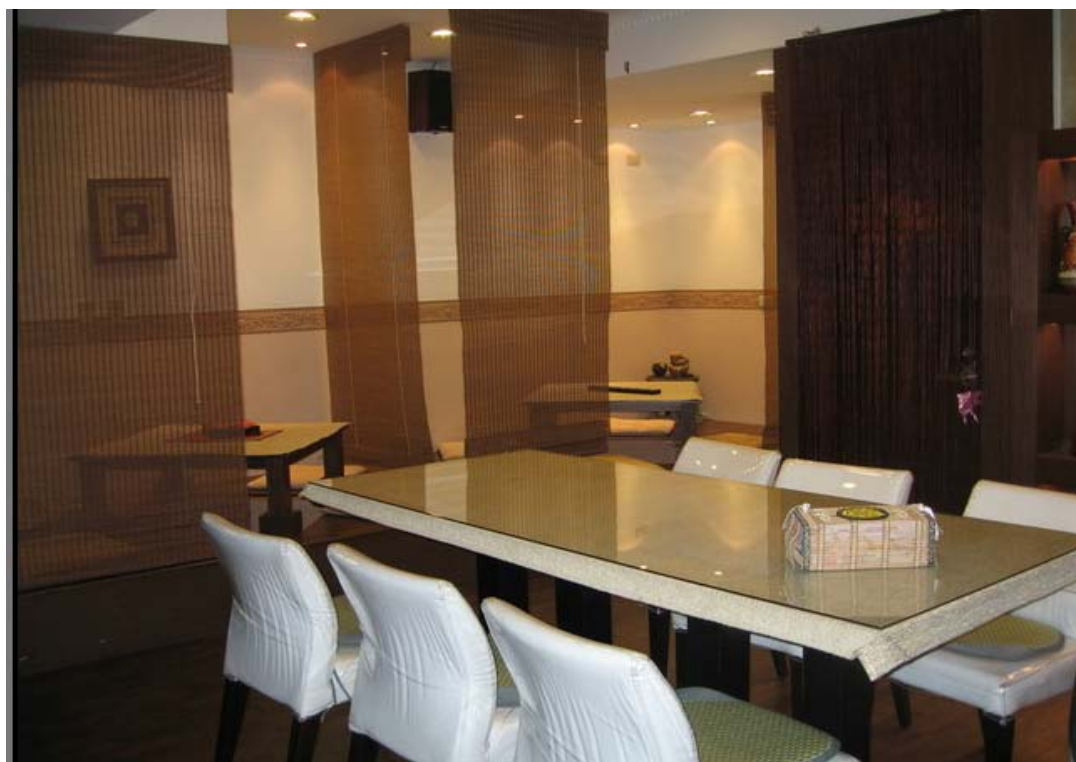
圖 4-3 A 里里辦公室漂亮的討論空間

全一改我對里辦公室的刻板印象 。因為她說，這樣她做起事來更有拼勁，而且也讓里民來到這裡也變得更有活力以及好心情。因此當我接觸到里辦公室的衝擊後，深深感覺這種充滿活力的里長究竟在她擔任里長的過程中，是如何發揮魅力並管理整個里的事務[實習日誌 960311]，所以下面附了一張 A 里辦公室的沙龍照(見圖五)。但是相較之下 B 里屬於老舊社區，剛到這個里的時候，並沒有一個很明顯的出入口，在詢問路人之後發現里辦公室身處狹小的半山腰，很特殊的是整個里的大半空間就擠在小小的山腰上，社區每一落跟下一落之間都有階梯式的小道路連接著。初到這個地方，映入眼簾的就是「暗、舊、潮濕」，而且里辦公室的指示非常的不清楚，問了很多當地居民還是一臉困惑的我剛好就在路上遇到里長， 但除非是當地居民，否則我也會對這樣的里辦公室環境有那麼一點點的距離感 [實習日誌 970307]，所以其里辦公室就比較一般，屬於住家與里辦公室同一的情況，感覺新世代的里長以及較為資深的里長在里辦公室的安排上有不同的喜好，而這或許是幾十年前當里長跟現在當里長在空間網絡的拓展方面不一樣的地方。