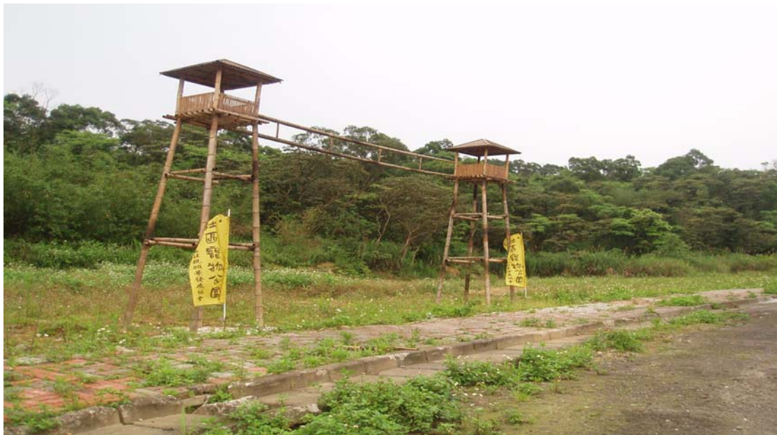
圖 4-2 另人驚艷(厭!?)的寵物公園

.....接著我們前往靠近【靜社區】旁的聯外道路，這時候來到了里內由社區發展協會所成立的寵物公園(見圖四)，而這也是里長有所抱怨的地方，這個社協爭取到很多經費，但是其結果並不如預期，因此阿姨提到這就是目前政府在撥用社區發展的一些經費時，對於政府一方後續的監督以及另一方社區團體對整體維護心態的制度性之不足非常嚴重，而這也許是未來台灣地方治理中亟欲檢討之所在.....(實習日誌 960331)