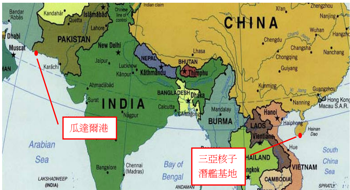
圖 5.2 瓜達爾港與中共核子潛艦基地位置圖