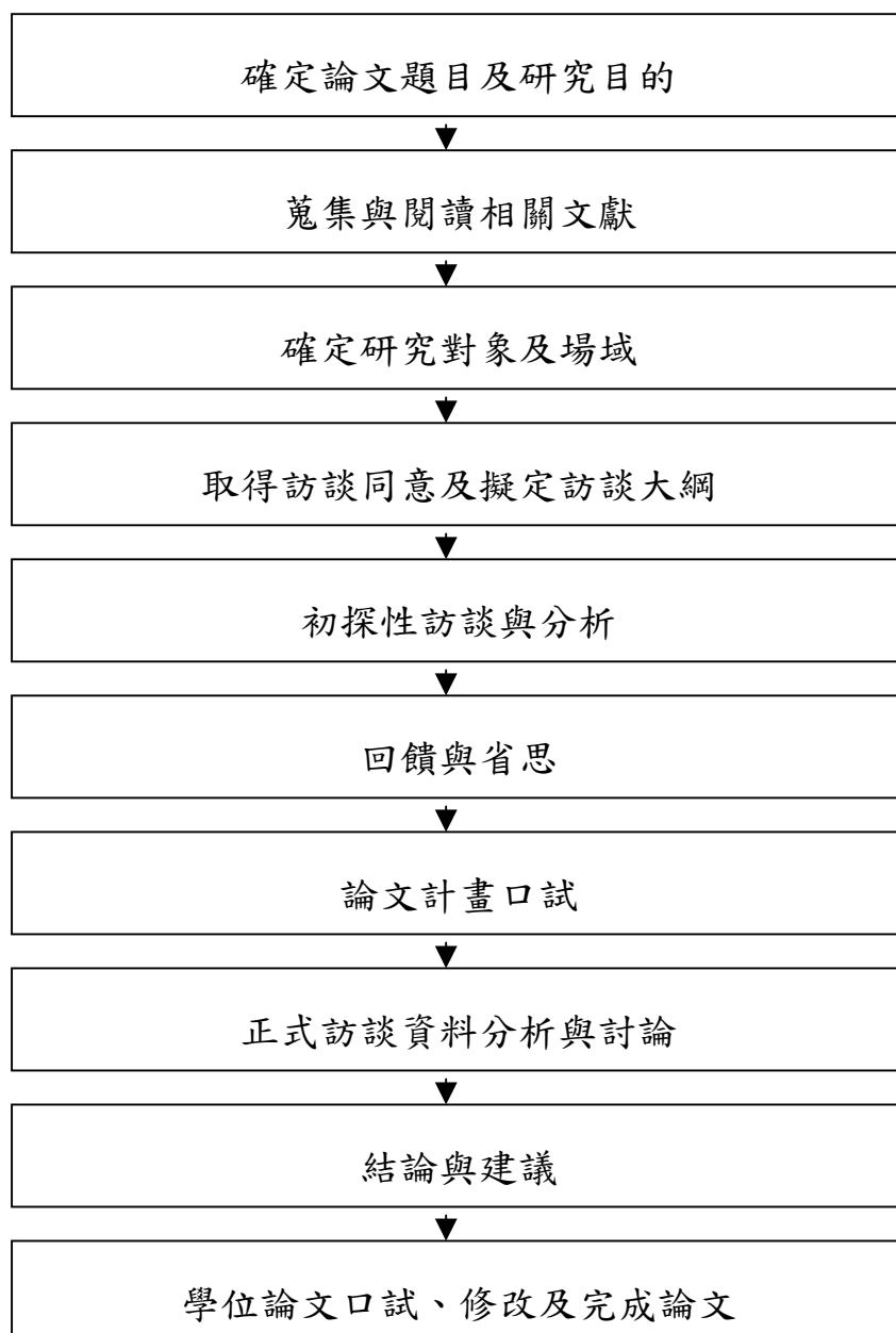
圖 3-2 研究流程圖