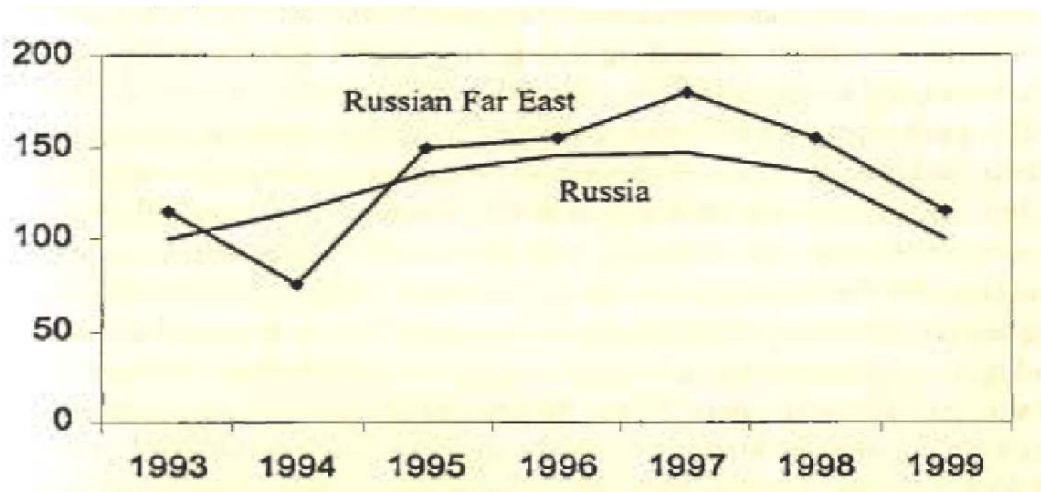
圖一：早期俄羅斯遠東地區與俄國平均對外貿易成長率（以 1992 年為基期）

區現有資源為蘇聯的當務之急，戈巴契夫於 1986 年 7 月 28 日的「符拉迪沃斯托克（Владивосток，中文又另譯為「海參崴」）演說」中， 8 發表了有關整合蘇聯與遠東地區經濟發展演說，翌年，提出了一項 1987-2000 年的長期開發計劃，主要內容是以：促進當地產業現代化、積極引入亞太國家的技術、資金以及協助遠東區的發展， 9 因此從蘇聯時期俄羅斯中央政府就已經了解，遠東地區是相對落後於歐俄政治中心，但卻有著特殊的地理位置與其戰略價值。而早期俄羅斯對外貿易的發展，整體上在 1990 年後呈現的是緩慢增長的趨勢，但是俄國遠東地區的對外貿易成長趨勢，由圖一可知，早期俄羅斯的遠東地區的貿易成長率是在俄羅斯平均水準之上，但是由圖二得知，俄羅斯遠東地區的重大投資趨勢，卻是從 1991 年後，呈現下降與明顯落後於俄國的平均水準。