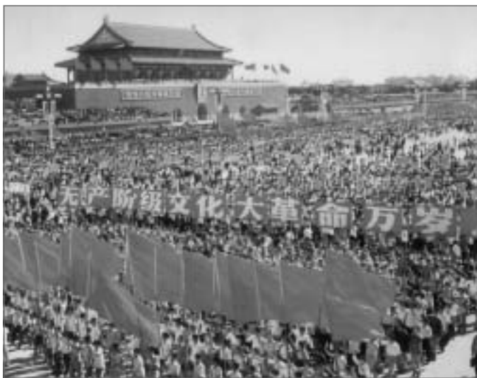
文革期間浩浩蕩蕩的遊行隊伍

在中共「政治掛帥」，尤其是北京「中南海」牽動政局發展之下，文革期間的「高層政治」，自然作為本書的主要部分。在此一層次的探討裏，除了前述高層精英在文革中的意向與作為，作者也突出中文文革相關著作較少涉足的體制制度與組織發展的問題。包括：毛澤東認為對之綁手綁腳、欲去之而後快的黨機器——文革前後中央「五大部」的介紹；黨政部門在運動中的遭遇；