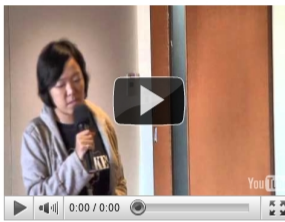
【430向日蔭藤核行動】宣告