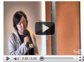
【430向日葵廢核行動】宣告