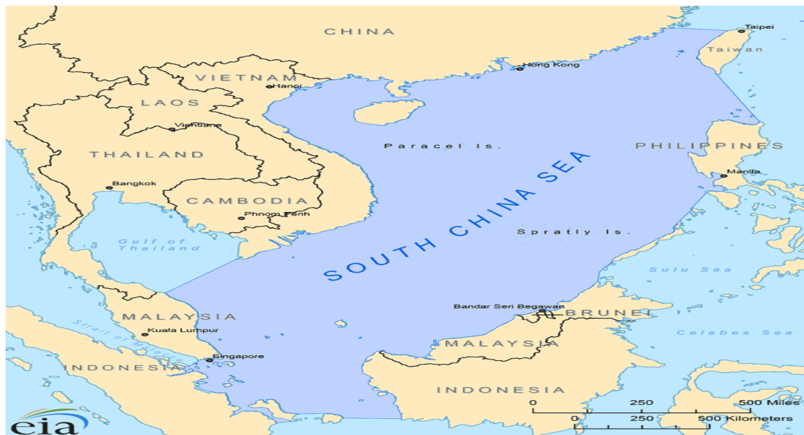
圖 2 - 1 南海海域範圍

(Andaman Sea)相通，並經由卡瑞馬塔海峽(Karimata Strait)、蓋斯帕海峽(Gaspar Strait)與爪哇海(Java Sea)相通(如圖 2 - 1)。 6 整個南海海面上，諸群島東西距離約 1,300 公里、南北距離約 2,400 公里，涵蓋海域面積約 350 萬平方公里， 7 依據中華民國政府內政部 1946 年至 1947 年間所作調查統計，共有 159 個小島或礁嶼，散佈在南海中。 8 此海域順時針方向所涵蓋的國家，東有菲律賓，南有印尼及東印度群島，西南有馬來西亞，西有越南、泰國、緬甸等國，北有中國，東北則有臺灣，南海面積在全球 54 個大海之中僅次於地中海，其中此海域包括四大群島—東沙群島(Patratas Is.)、西沙群島(Paracel Is.)、中沙群島(Macclesfield Bank)及南沙群島(Spratly Is.)。