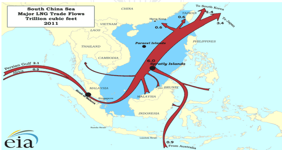
圖 2 - 3 經南海之天然氣輸送圖