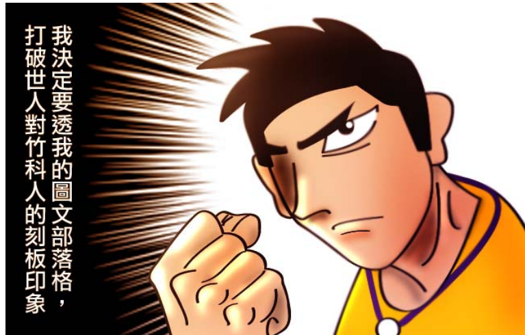
圖 1-1 竹科沒有新貴圖文部落格