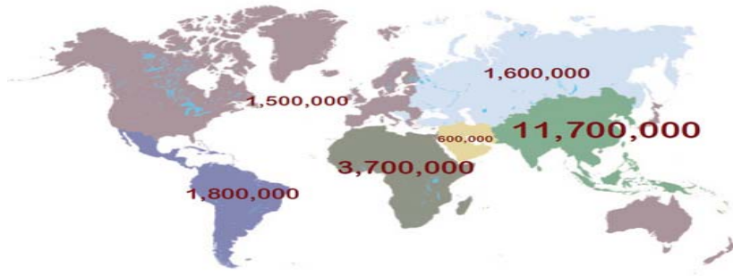
圖 2-2 全球人口販運強迫勞動被害人地區分布(2002-2011 年)