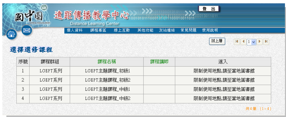
圖 3 系統自動偵測會員在非授權範圍使用

未來系統可進一步發展會員認證機制，透過與各縣市圖書館自動化系統認證作業，讓讀者可在圖書館外使用數位學習教材。唯目前已購置的數位學習教材授權範圍，均須再增購使用範圍，避免造成侵權的情形。