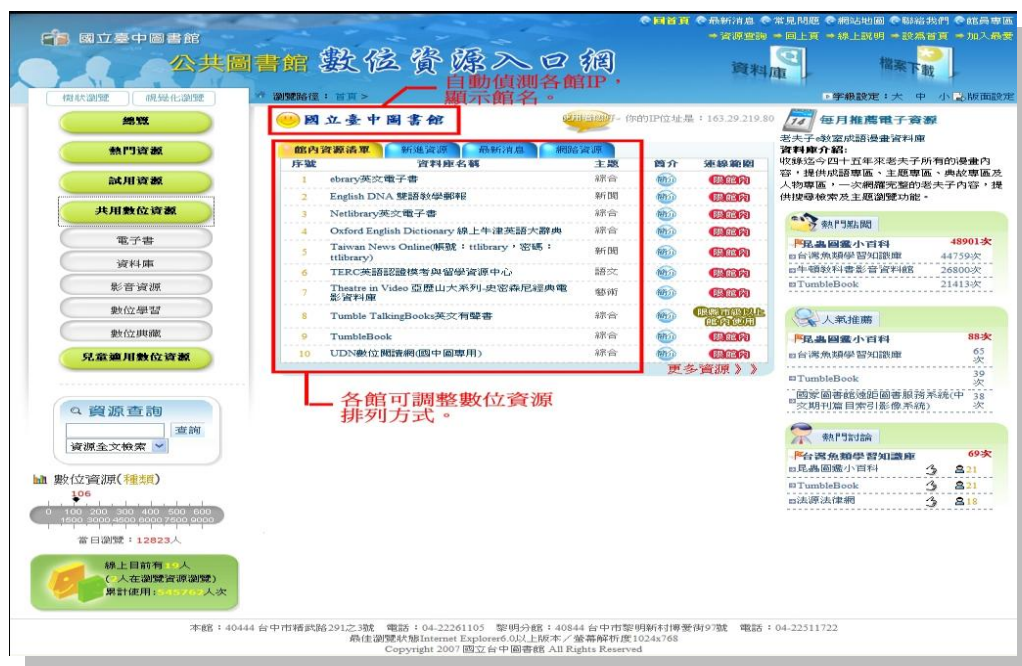
圖 1 公共圖書館數位資源入口網首頁

公共圖書館數位資源入口網 ( http://erm.ntl.gov.tw ) 主要做為國立臺中圖書館購置各種共用電子資料庫系統之入口網站，彙集各種數位資源及公共圖書館資料，藉由各館 IP 網址設定，由系統判斷連結網址，顯示該館名稱，自動過濾出可以使用之數位資源。由於系統提供給全國公共圖書館連結使用，希望各館在部分讀者用電腦上設定本網站為首頁，因此除能自動判斷 IP 範圍顯示各館名稱外，各館亦可進入後端管理介面，自行調整數位資源的排列方式。(見圖 1)