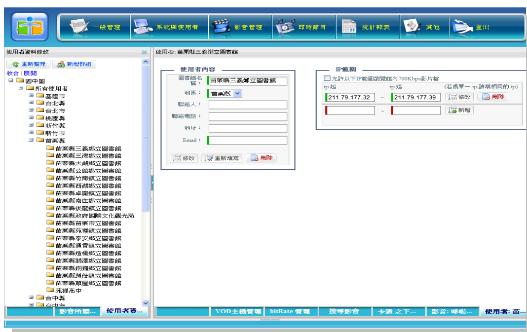
圖 2 線上視聽媒體中心後端管理公共圖書館 IP 範圍設定

全開放外,其餘均有 IP 使用範圍之限制。系統可設定各公共圖書館的 IP 網址,當新購影音資源轉入建檔後,再設定可授權使用的館別(見圖 2)。與一般數位資源不同之處,影音資源對外播送時相當佔網路頻寬,因此可再設定高畫質影音檔案(700 BitRate 以上)之播送館別,避免影響網路傳輸速度。