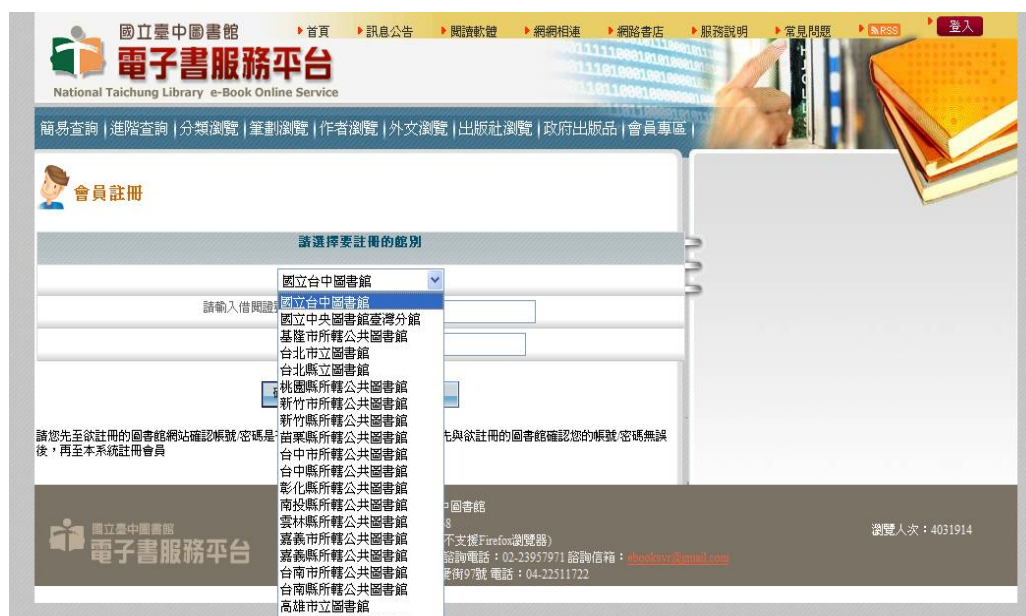
圖 4 會員註冊選擇認證館別功能